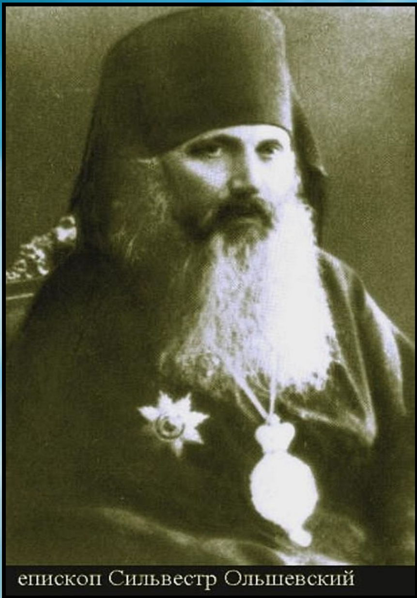
епископ Сильвестр Ольшевский

В 1918 году патриархом Тихоном ко дню Святой Пасхи был возведен в сан архиепископа.