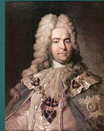
Павел Петрович Ягужинский первый прокурор РИ