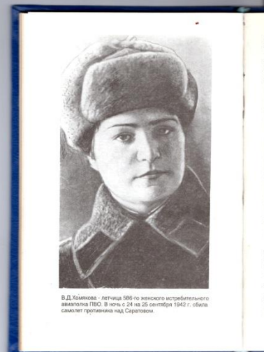
В.Д. Хомякова - летчица 586-го женского истребительного авиационного полка. В ночь с 24 на 25 сентября 1942 г. сбивает самолет противника над Саратовом.