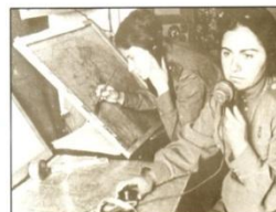
Курсы радистов при отделении Осоавиахим.