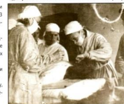
День и ночь за операционным столом. 1942 г.