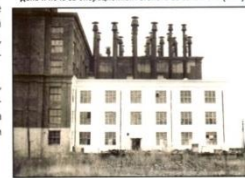
Здание мясокомбината. 1943 г.