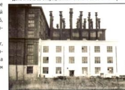
Здание мясокомбината. 1943 г.