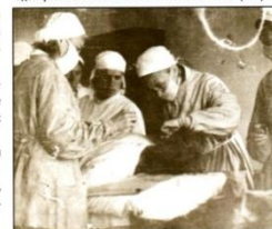
День и ночь за операционным столом. 1942 г.