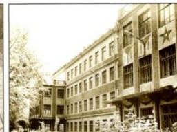
Здесь располагались заводоуправления. 1960 г.

промышленных предприятий. Самыми крупными из них были предприятия оборонного значения: московский завод №213 Наркомата авиационной промышленности и Брянский вагоностроительный завод им. Урицкого.