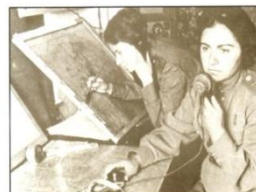
Курсы радистов при отделении Осоавиахим.