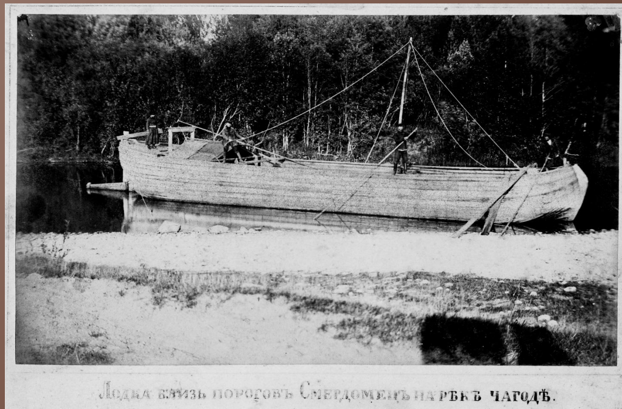
Лодка вблизи пороговъ Смердоменъ на рѣкѣ Чагодѣ.

Таким способом перевозили готовую продукцию.