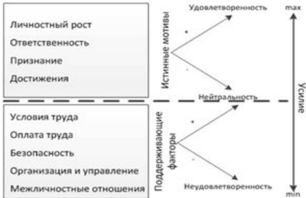
Рисунок 1. Влияние поддерживающих факторов и истинных мотивов на работу сотрудника