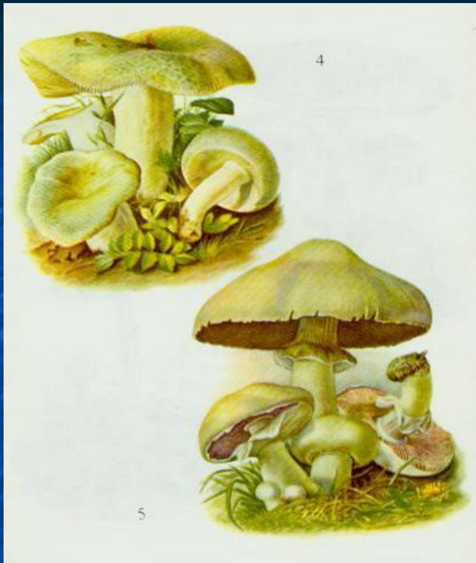
■ Сироїжка зелена Шампіньйон звичайний