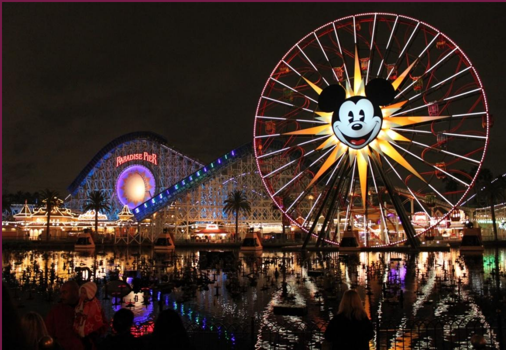
Колесо обозрения , ночной парк