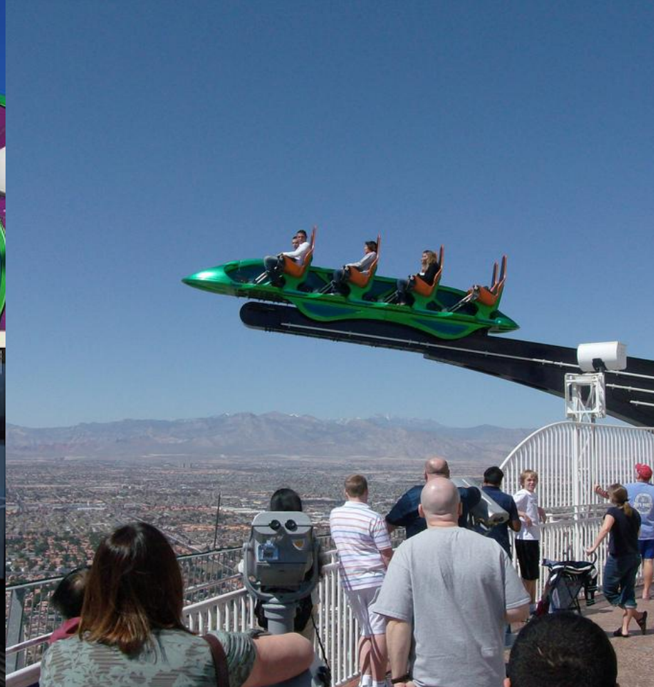
Стратосфера , аттракцион над городом