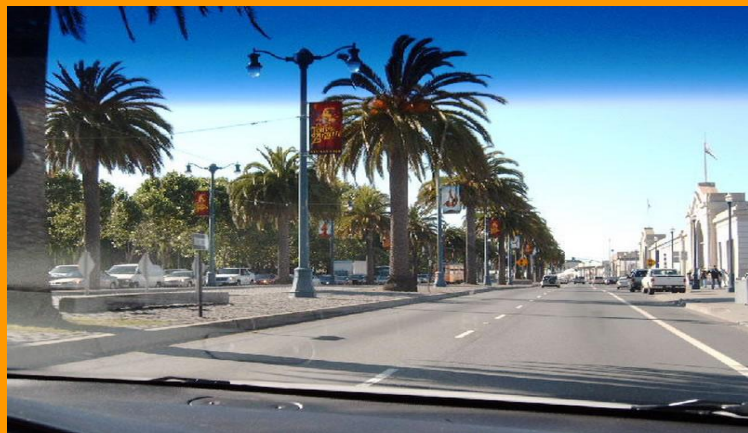
Пляж Лос-Анджелеса. Венес Бич