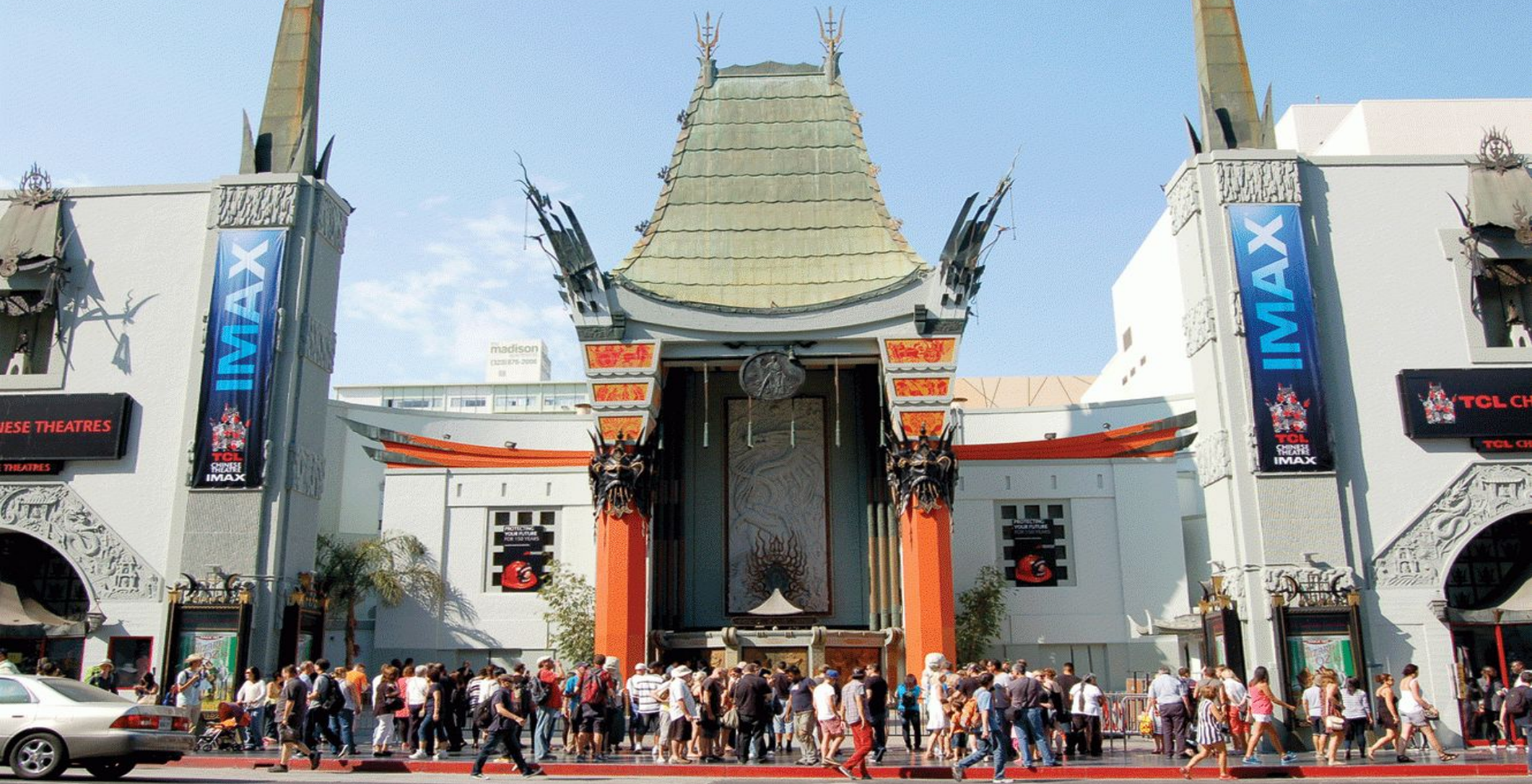
Лос-Анджелес. Китайский театр на Аллее Славы.