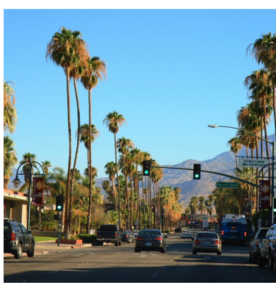
Городская и частная зоны в Лос-Анджелесе