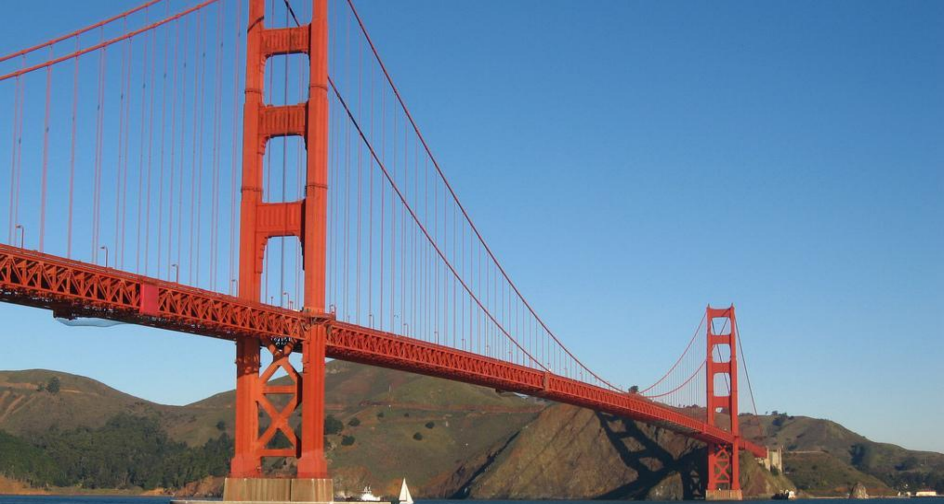
Мост Голден Гейт в Сан-Франциско