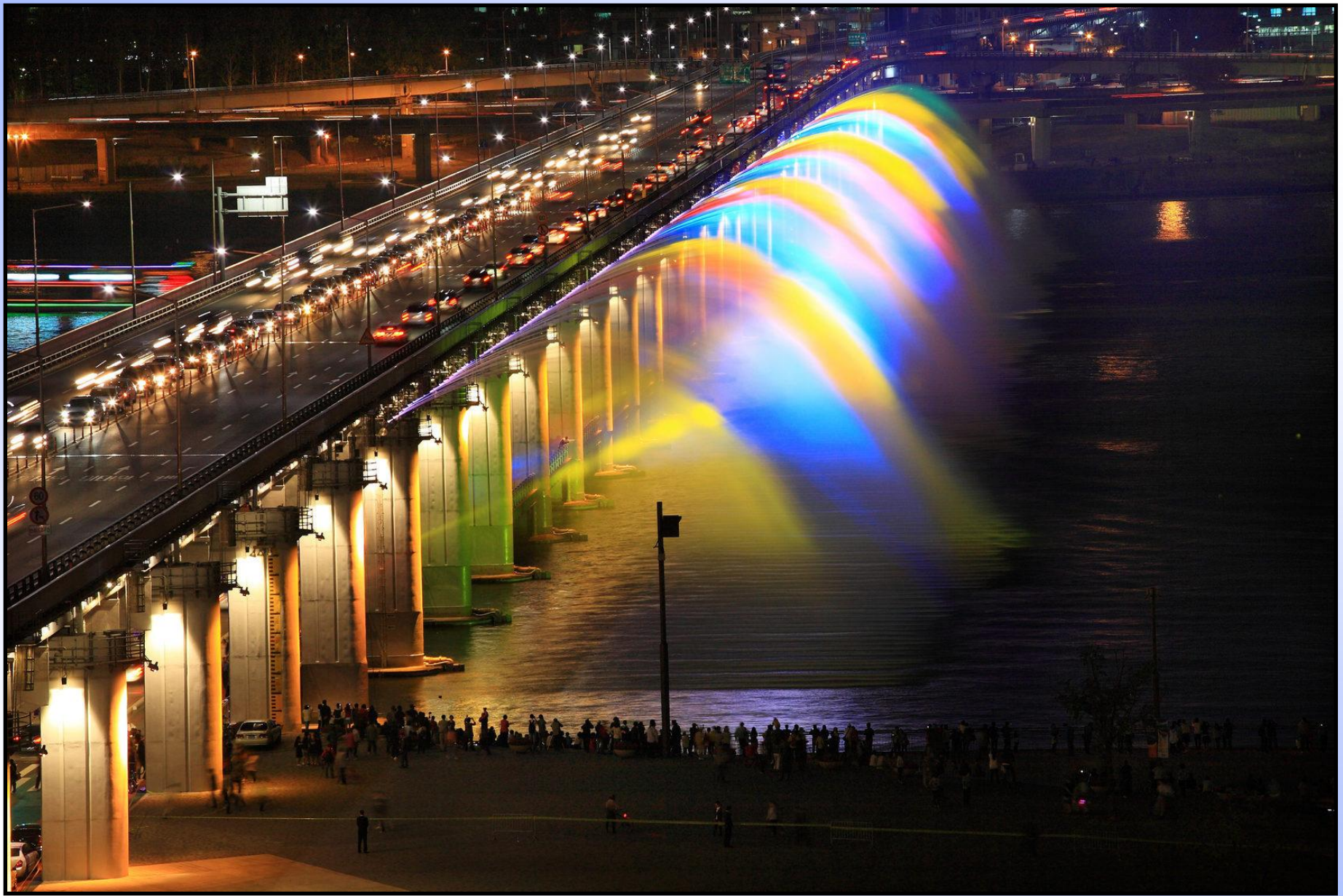
Фонтан «Лунная радуга» занесён в «Книгу рекордов Гиннеса» как самый длинный в мире