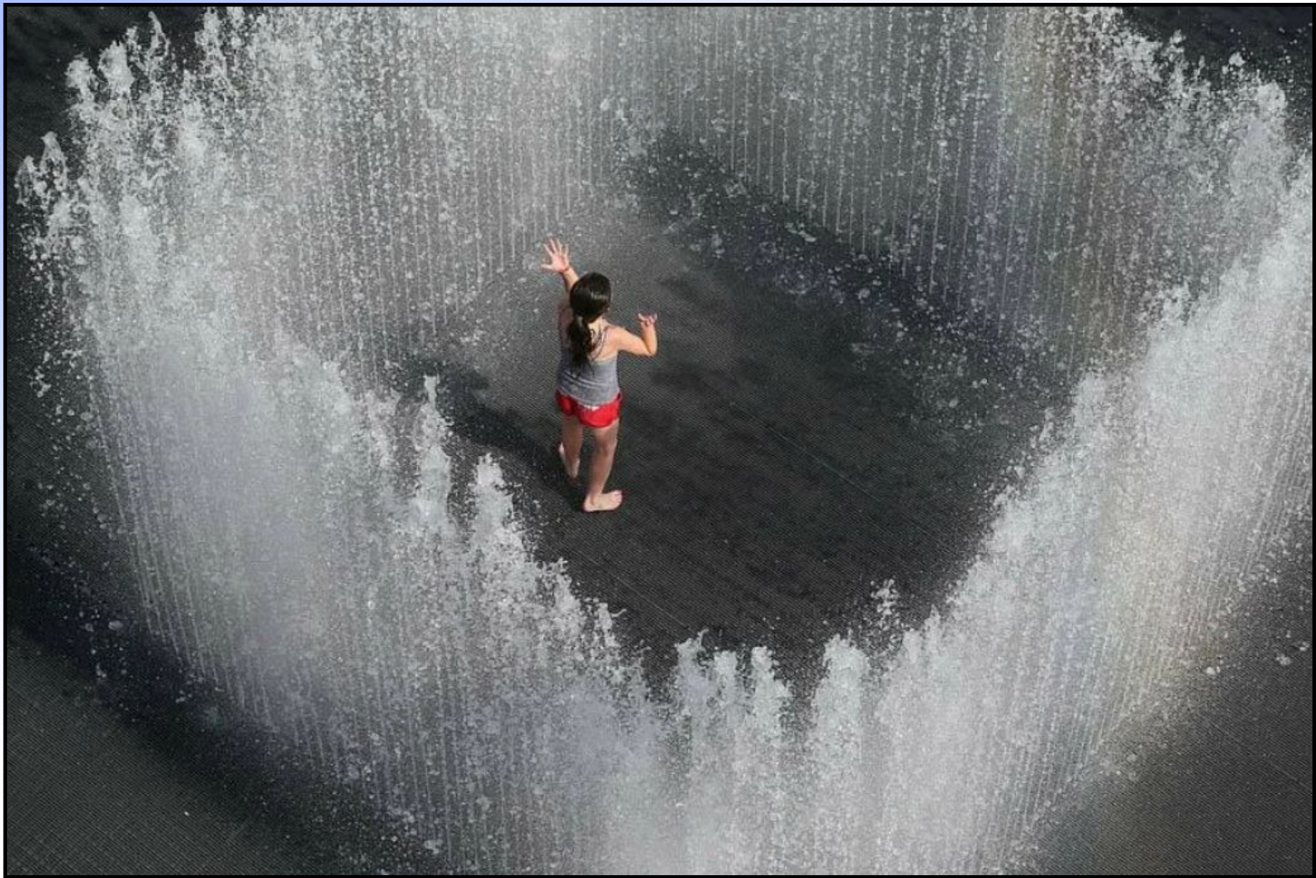
Девушка в ловушке внутри фонтана