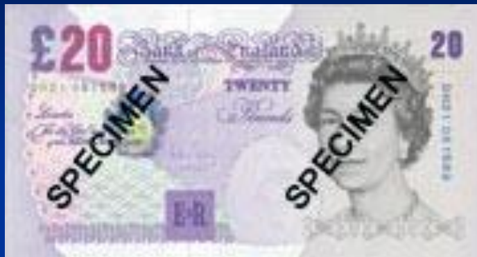
Британский фунт стерлингов