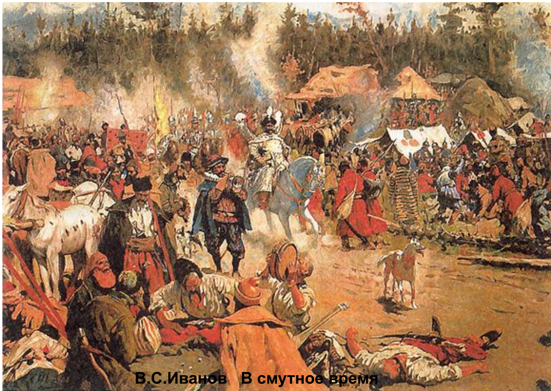
В.С.Иванов В смутное время