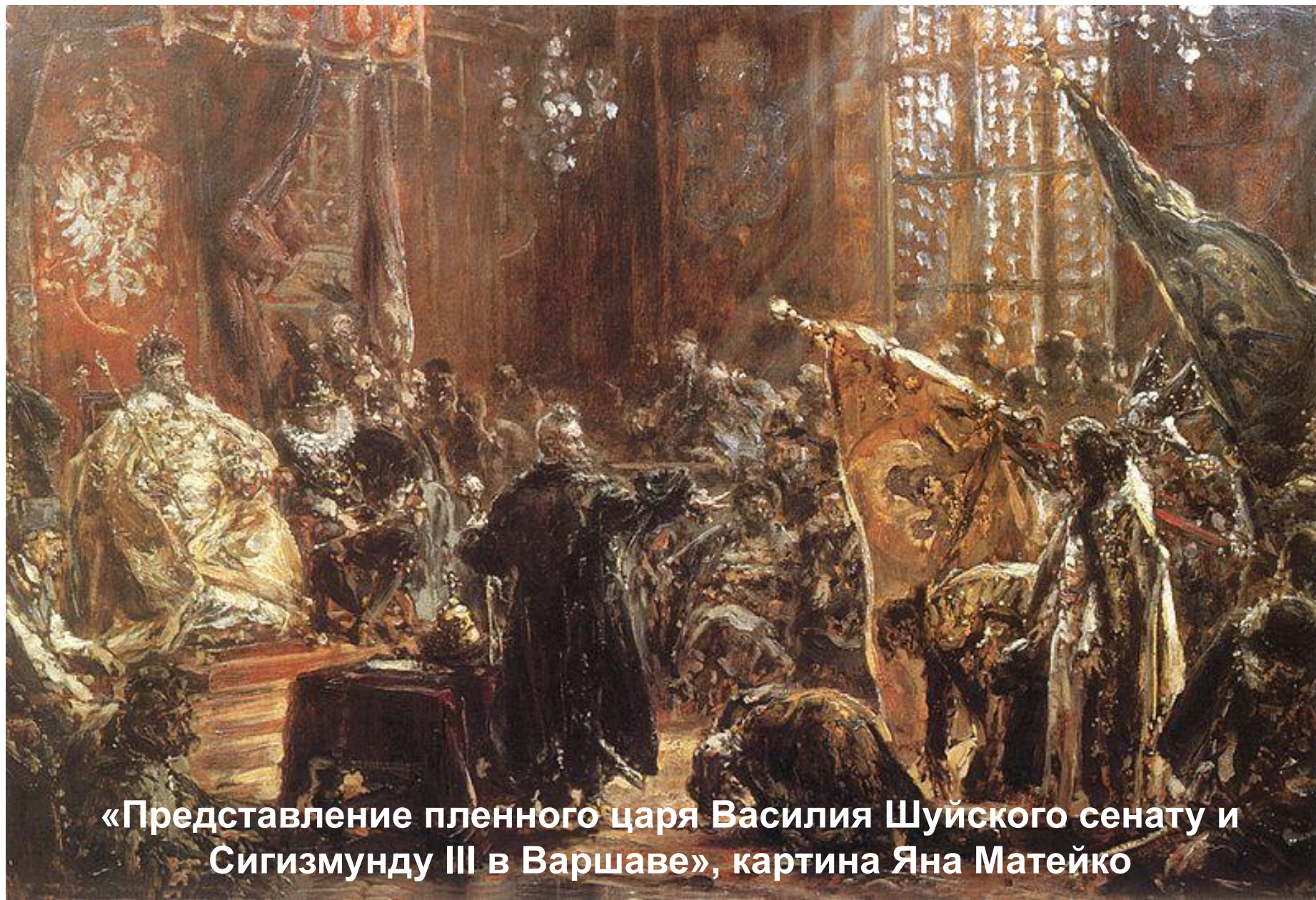
«Представление пленного царя Василия Шуйского сенату и Сигизмунду III в Варшаве», картина Яна Матейко