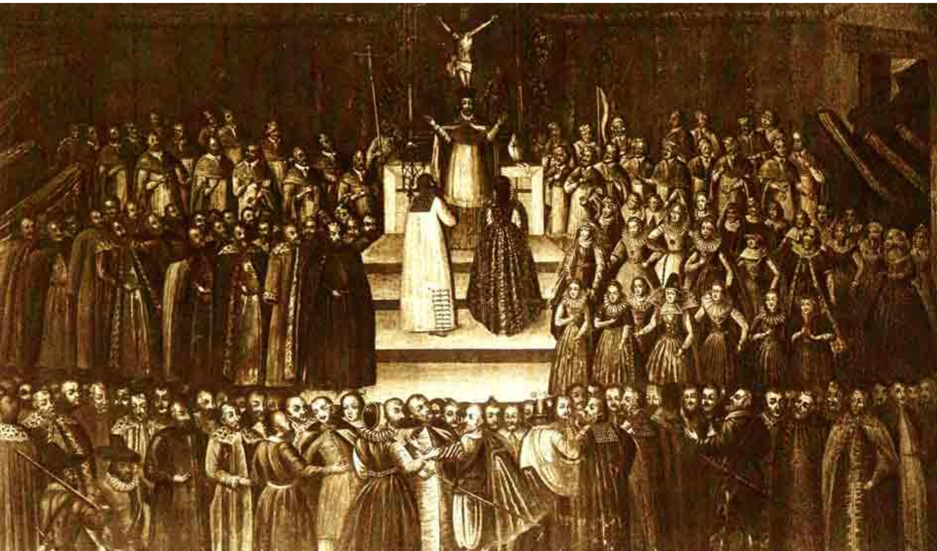
Венчание Лжедмитрия и Марины Мнишек в Москве