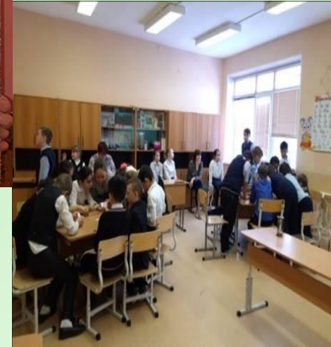
4г и 4д

Найти к картинкам животных название животных