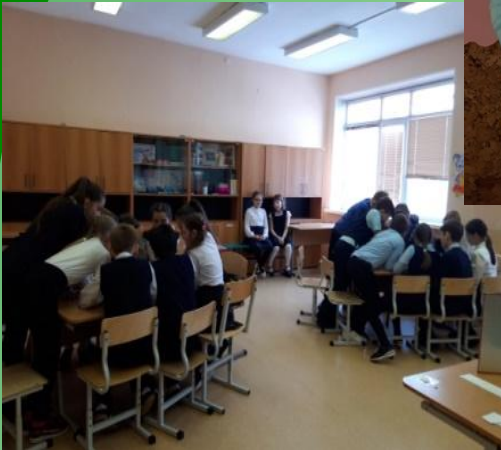
4б и 4в