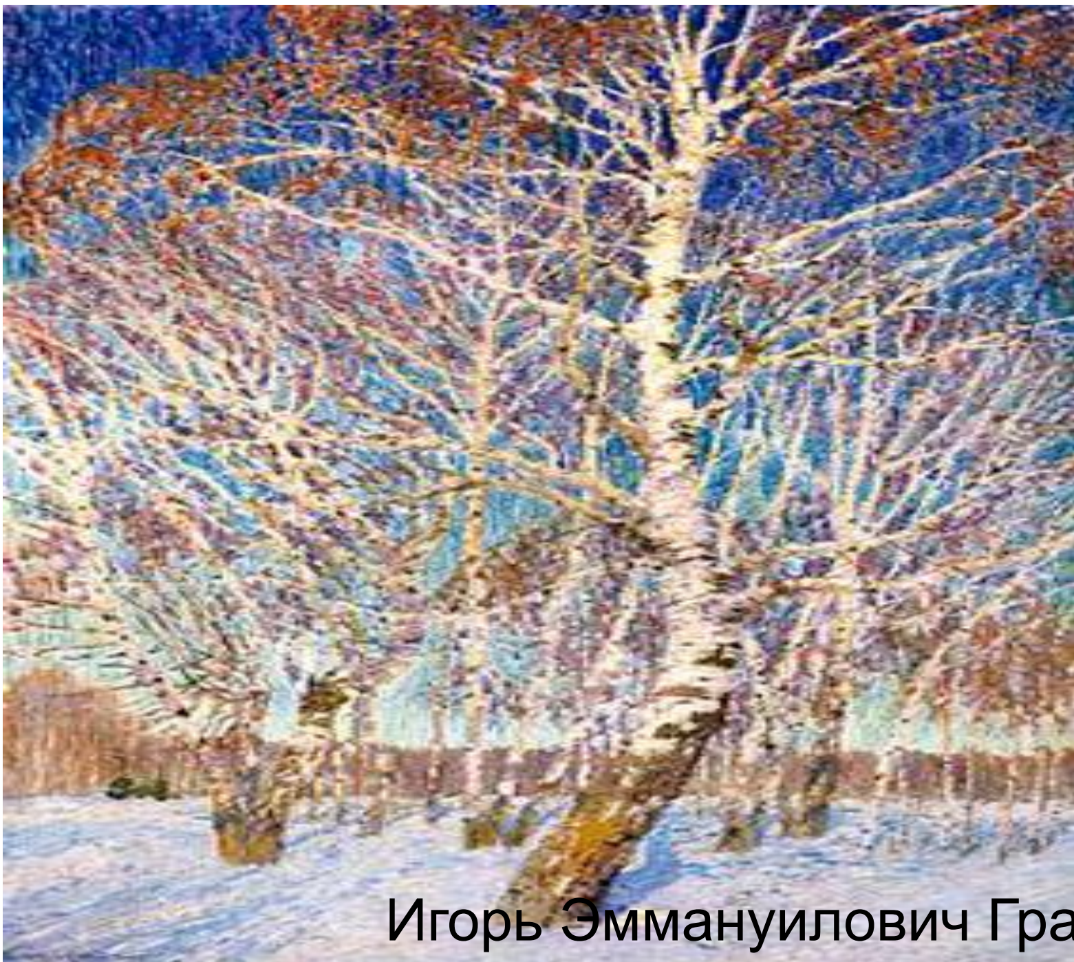
Игорь Эммануилович Грабарь