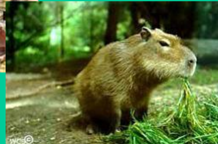
Капибара питается травой

Будучи наполовину водным животным, капибара прячется в воде, но отдыхать предпочитает на земле, уходя от края воды в поисках заросших травой пастбищ, где она могла бы пастись.