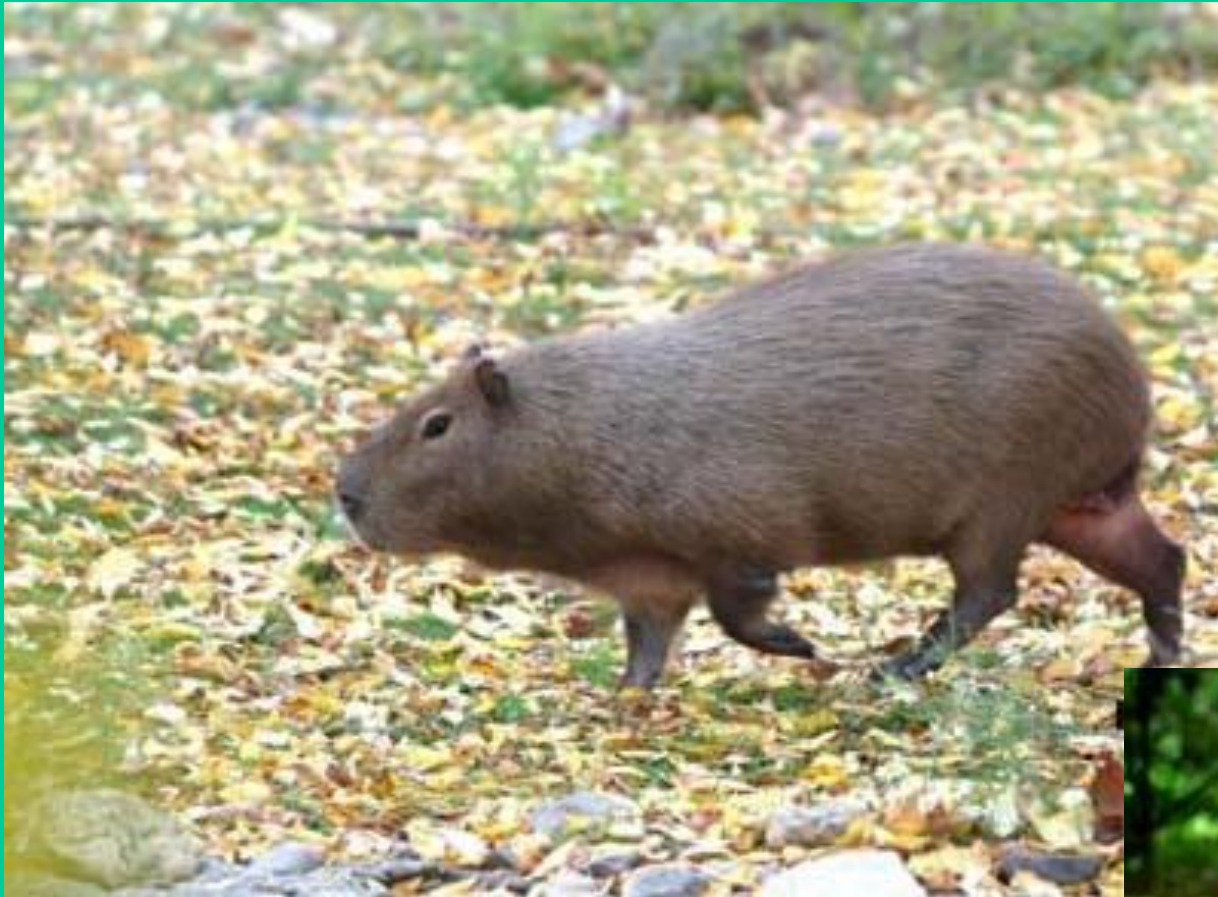
Капибара, или водосвинка

Будучи наполовину водным животным, капибара прячется в воде, но отдыхать предпочитает на земле, уходя от края воды в поисках заросших травой пастбищ, где она могла бы пастись.