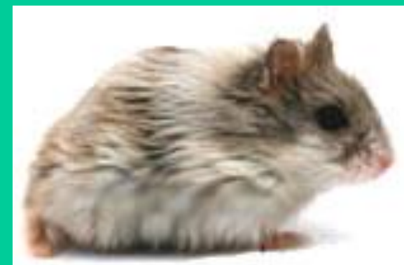
Русский карликовый хомячок