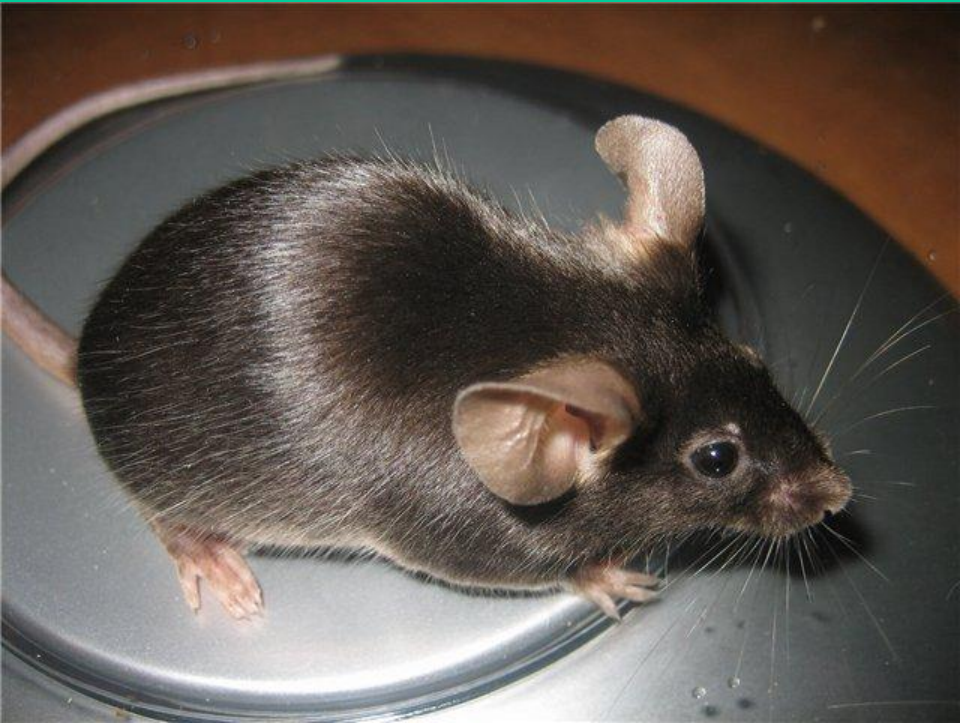
черный селф несатин