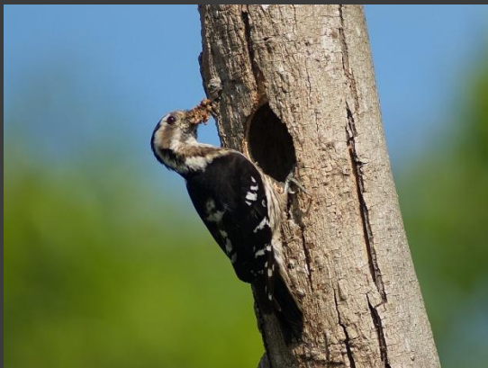
Малий сіроголовий дятел