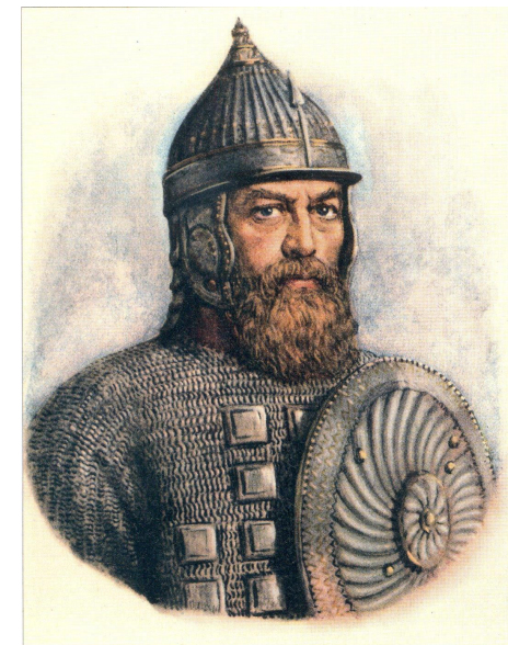
Л. П. Столыгво. Дмитрий Пожарский. 1949 г.