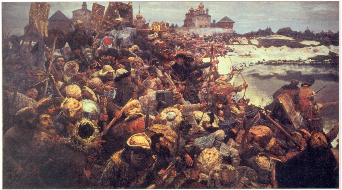
Г. Н. Горелов. Восстание Болотникова. 1944 г.