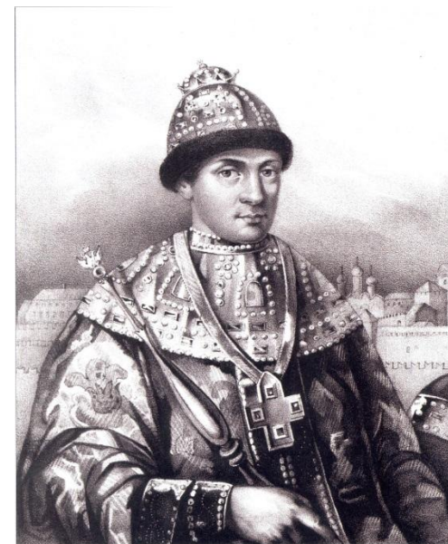
Царь Федор Иоаннович, Рисунок Зеленского с портрета в Кунсткамере в Академии наук.