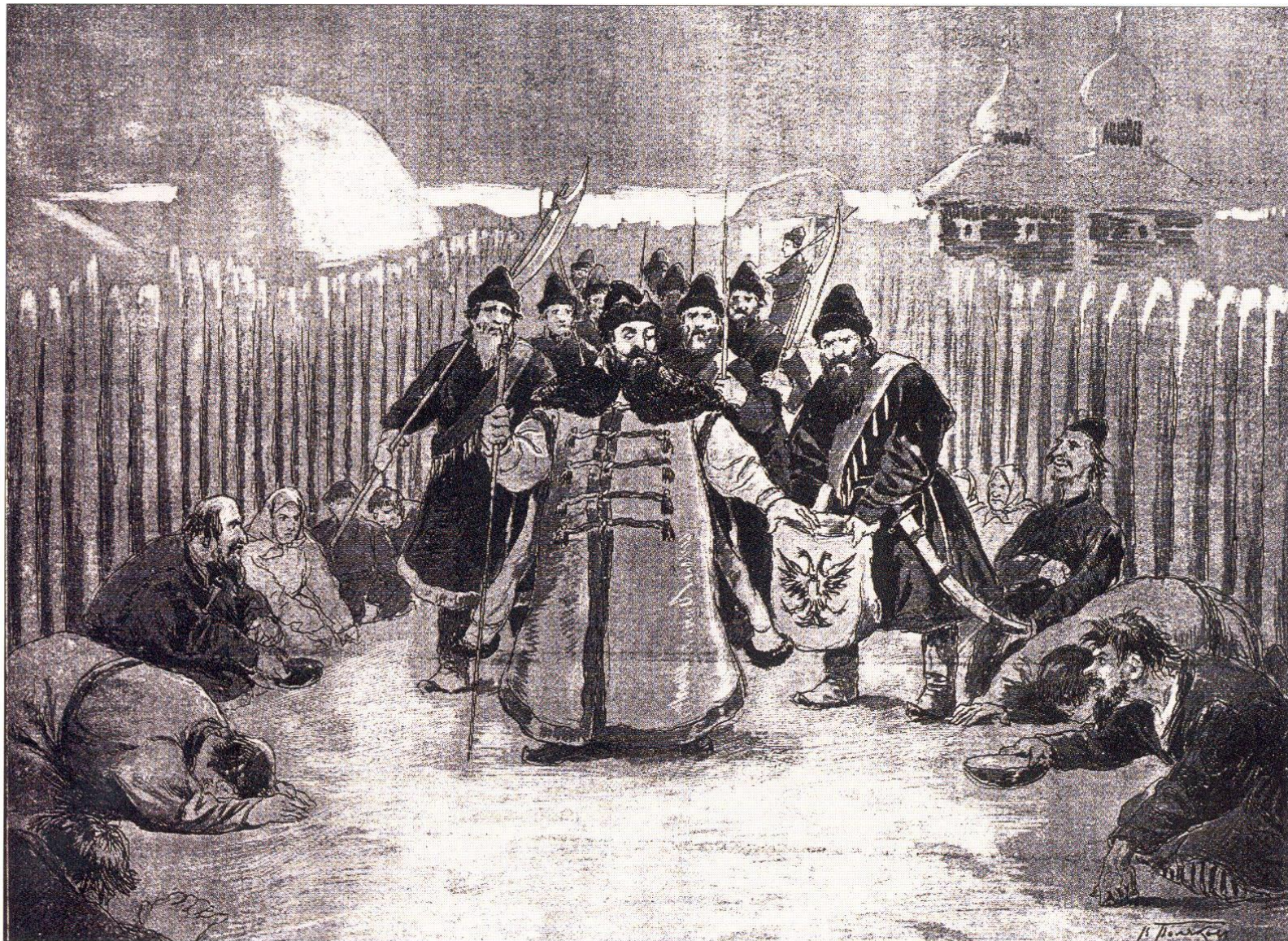
Царская милостыня. Гравюра с рисунка В. Полякова.