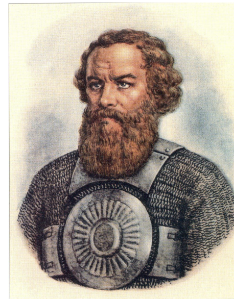
Л. П. Столыгво. Кузьма Минин. 1949 г.