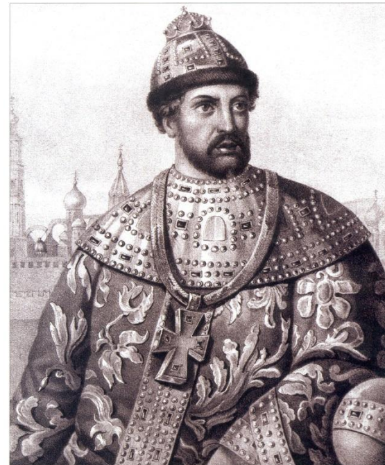
Царь Борис Федорович Годунов. Рисунок Зеленского с портрета в Кунсткамере в Академии наук.

Проводил политику укрепления самодержавия и усиления крепостной зависимости крестьян. По инициативе Бориса Годунова было учреждено патриаршество на Руси с 1589 г., заключен Тявзинский мир со шведами в 1595 г, укреплены западные и южные рубежи, активизировалась внешняя торговля, началось освоение Сибири, велось церковное и гражданское каменное строительство.