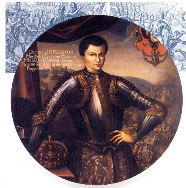
Неизвестный польский художник. Лжедмитрий I. XVII в.