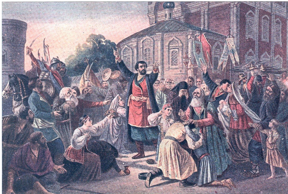
М. И. Песков. Обращение Кузьмы Минина к нижегородцам. XIX в.

Это ополчение было более организованным и его действия имели успех, столица была освобождена, встал вопрос о государе.