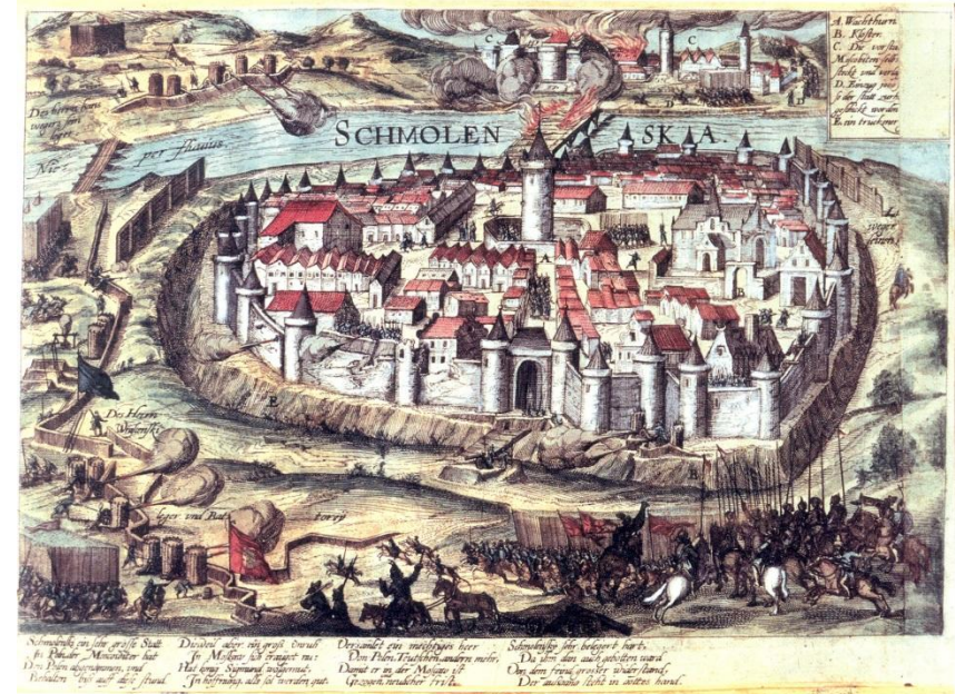
Осада Смоленска войсками Речи Посполитой в 1609–1611 гг. Гравюра.