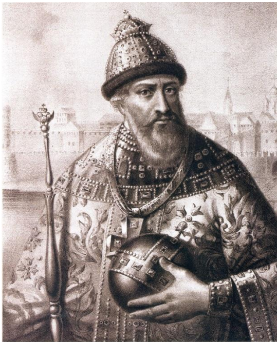
Царь Василий Иванович Шуйский.