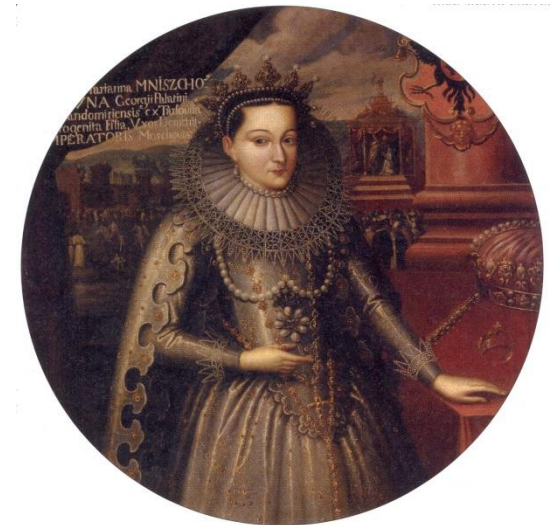
Неизвестный польский художник. Марина Мнишек. XVII в.