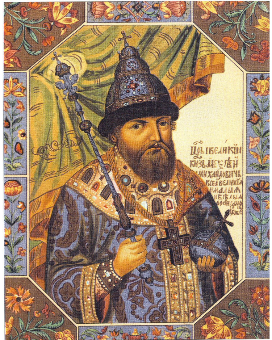
Царь Алексей Михайлович. «Титулярник». 1672 г. РГАДА.

В 1637 г. Был издан указ об увеличении срока сыска до 9 лет для беглых крестьян, а в 1642 – до 10 лет для беглых и 15 лет для вывезенных крестьян.