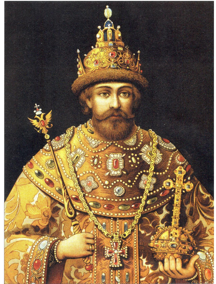
Царь Михаил Фёдорович. Хромолитография. 1913 г.

Сокращалась самостоятельность местной власти, в волости и области назначались воеводы, в руках которых была сосредоточена вся военная и гражданская власть.