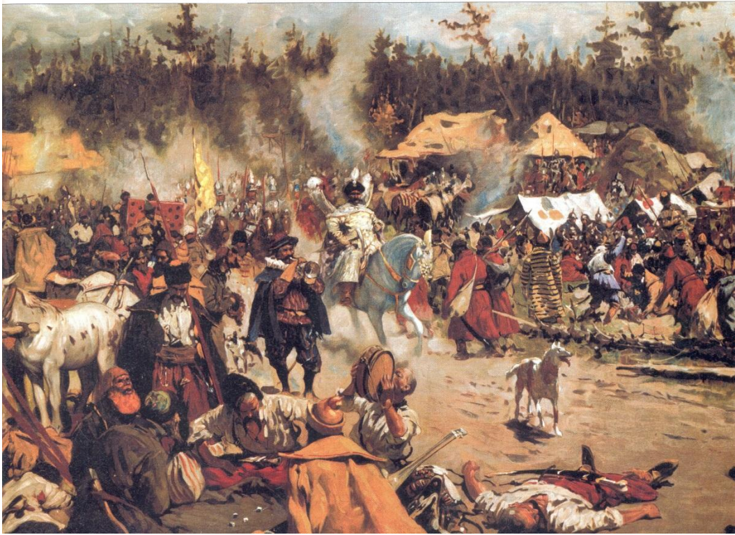
С. Иванов. Смутное время.