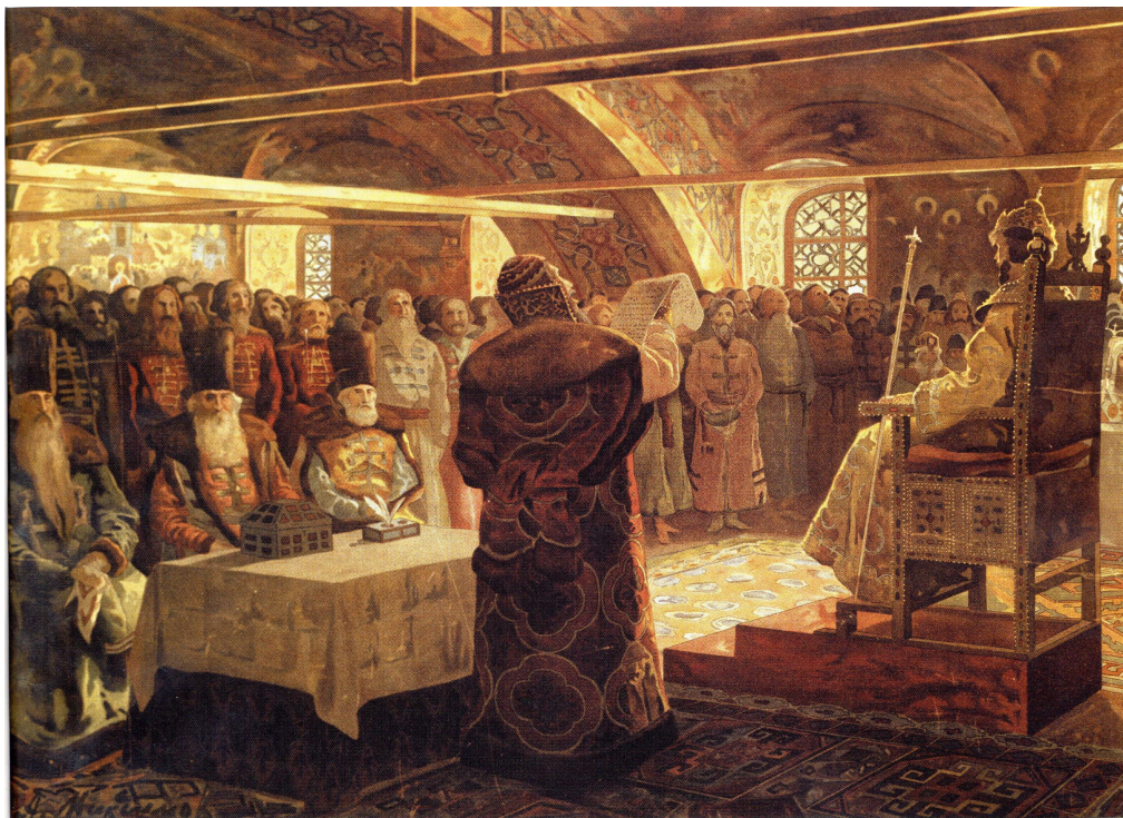
А. Максимов. Совет всея Руси.

Взяв курс на стабилизацию положения в стране, правительство опиралось именно на настроение большинства. В государстве, подорванном смутой, юный и малоопытный царь Михаил мог удержаться на престоле только благодаря общественной поддержке – Земские соборы собирались регулярно (10 лет ежегодно).