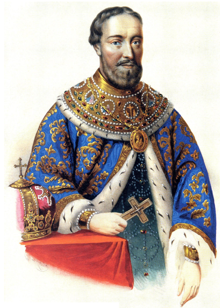
Федор Никитич Романов-Юрьев-Захарьин, в монашестве Филарет.

Боярская дума обсуждала административные и судебные вопросы, составляла указы и законы. Члены думы для проведения мероприятий (конкретных) создавали специальные комиссии, а также назначались послами, начальниками приказов, полковыми и городскими воеводами.