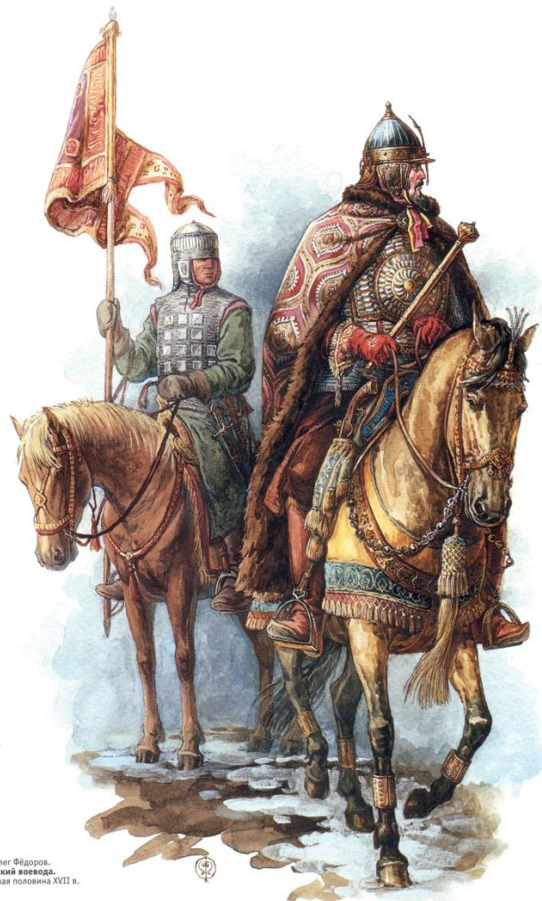
© Олег Федоров. Русский воевода. Первая половина XVII в.

На территорию ослабленной междоусобной войной России двинулись отряды польских шляхтичей и запорожских казаков. В июне 1608 года войско Лжедмитрия подошло к Москве, не сумев взять город, они стали лагерем у села Тушино. Была образована «воровская Боярская дума», действовали приказы от имени «царя Дмитрия», жаловались чин и земли. Лжедмитрий II получил прозвище «Тушинский вор» или просто «вор».