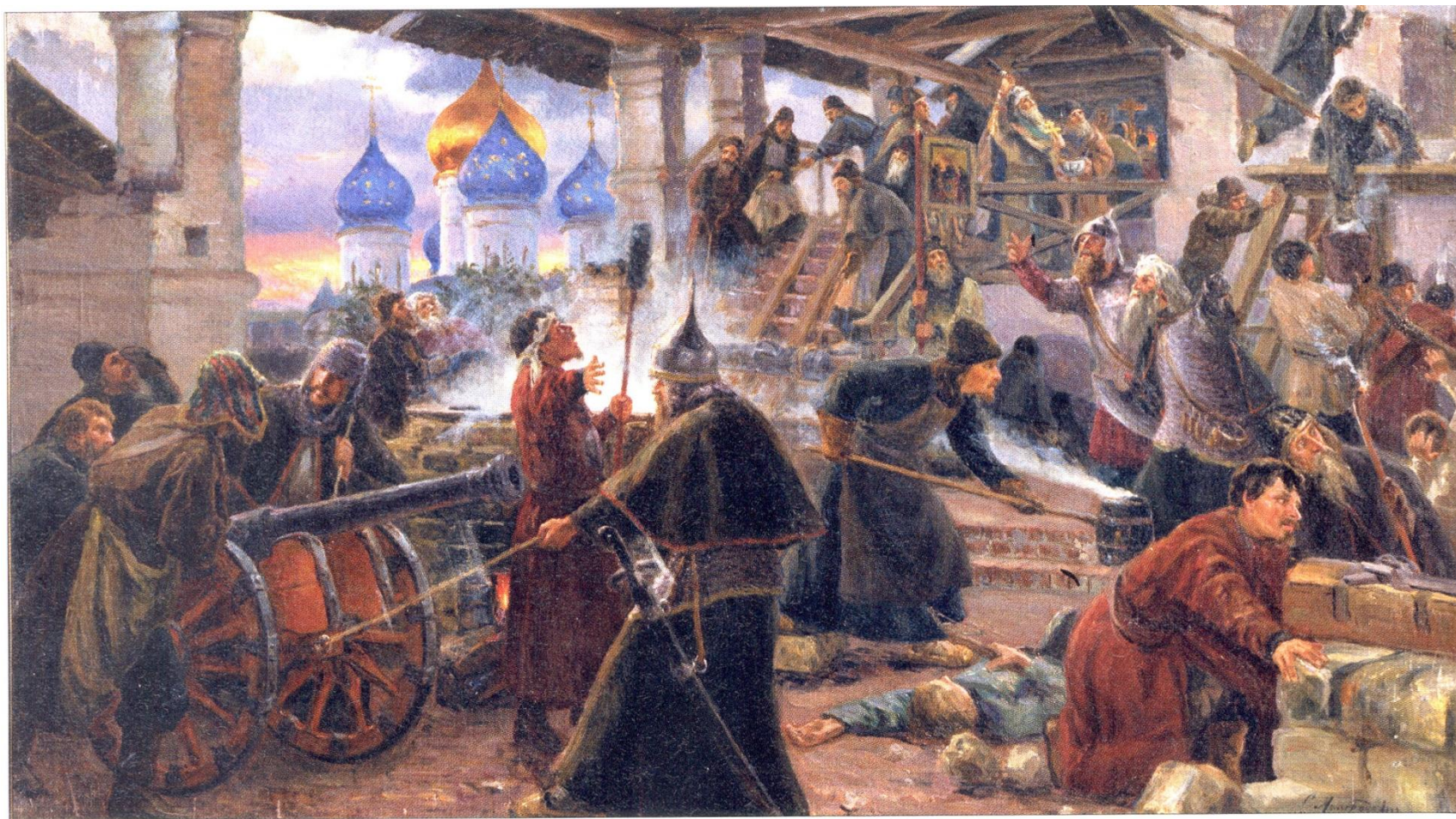
С. Д. Милорадович. Оборона Троице-Сергиевой лавры в 1609 г. 1893 г.