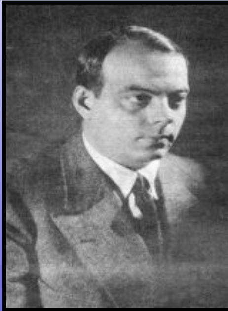
Антуан Мари Роже де Сент- Экзюпери (1900-1944)