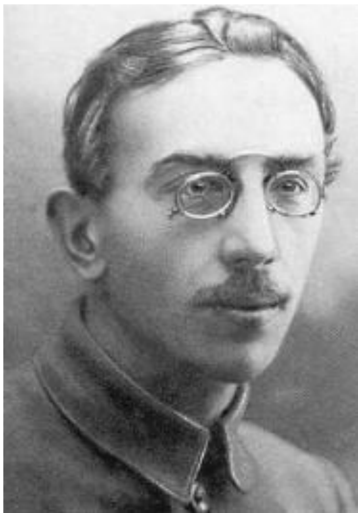
Н.Осинский- 1-й председатель ВСНХ

1 декабря 1917 г. ВЦИК образовал ВСНХ для управления и регулирования экономики страны. 14 декабря банковское дело было объявлено монополией государства. Частные банки и их средства были национализированы. В январе проводится национализация транспорта, в апреле - внешней торговли. РСФСР отказалась признать царские долги, отменила право наследования.