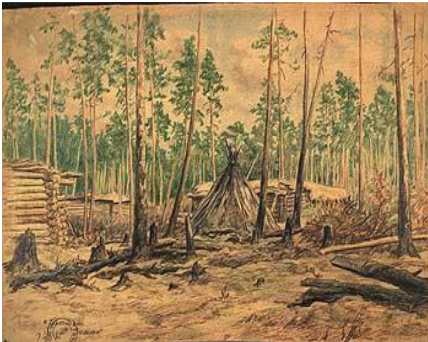
ЗИМНИК. ЮРТЫ ЧЕХЛОМЕЕВЫ