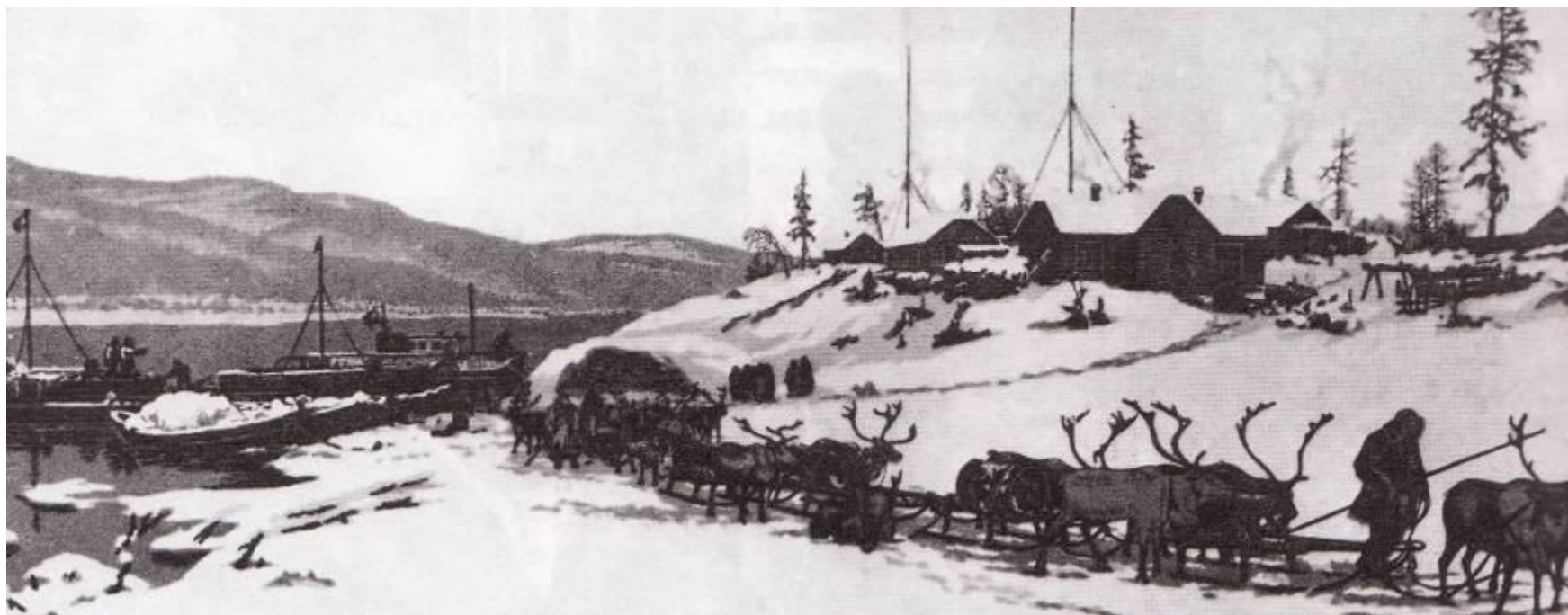
Фактория на Тунгуске. 1958.