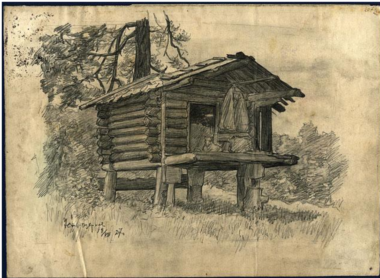
Усть-Озёрное 18 июля 1927 г.