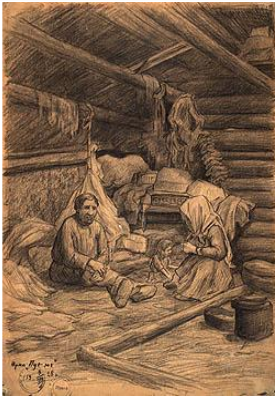
ИНТЕРЬЕР ДЕРЕВЯННОГО ЧУМА