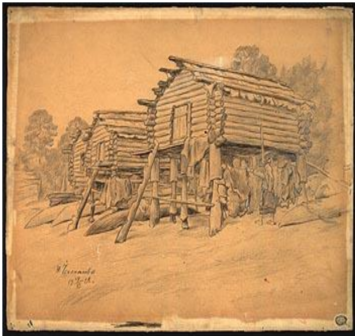
ЛАБАЗЫ У ЛЕТНИКА