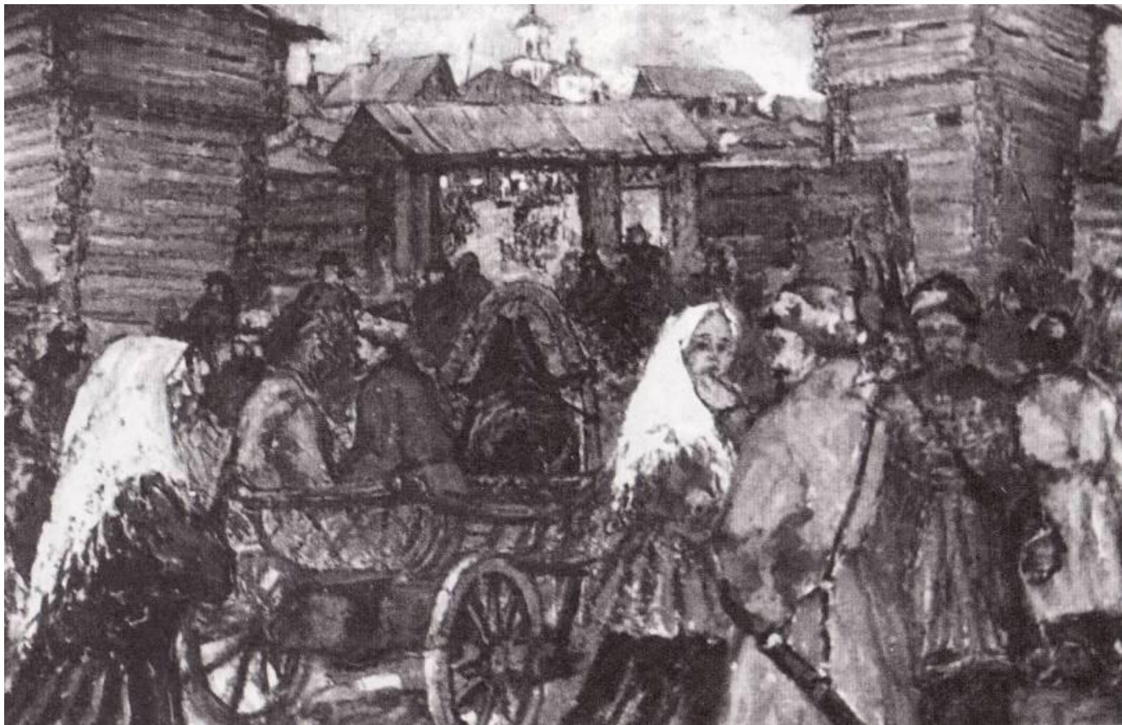
В старом Красноярске