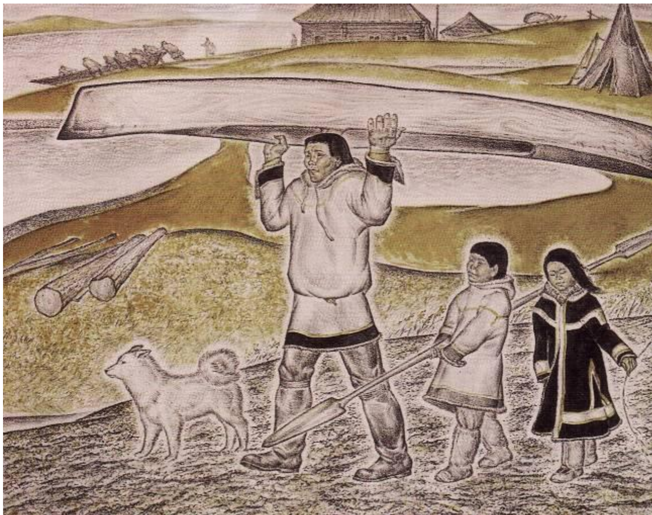
Новая лодка. 1973.