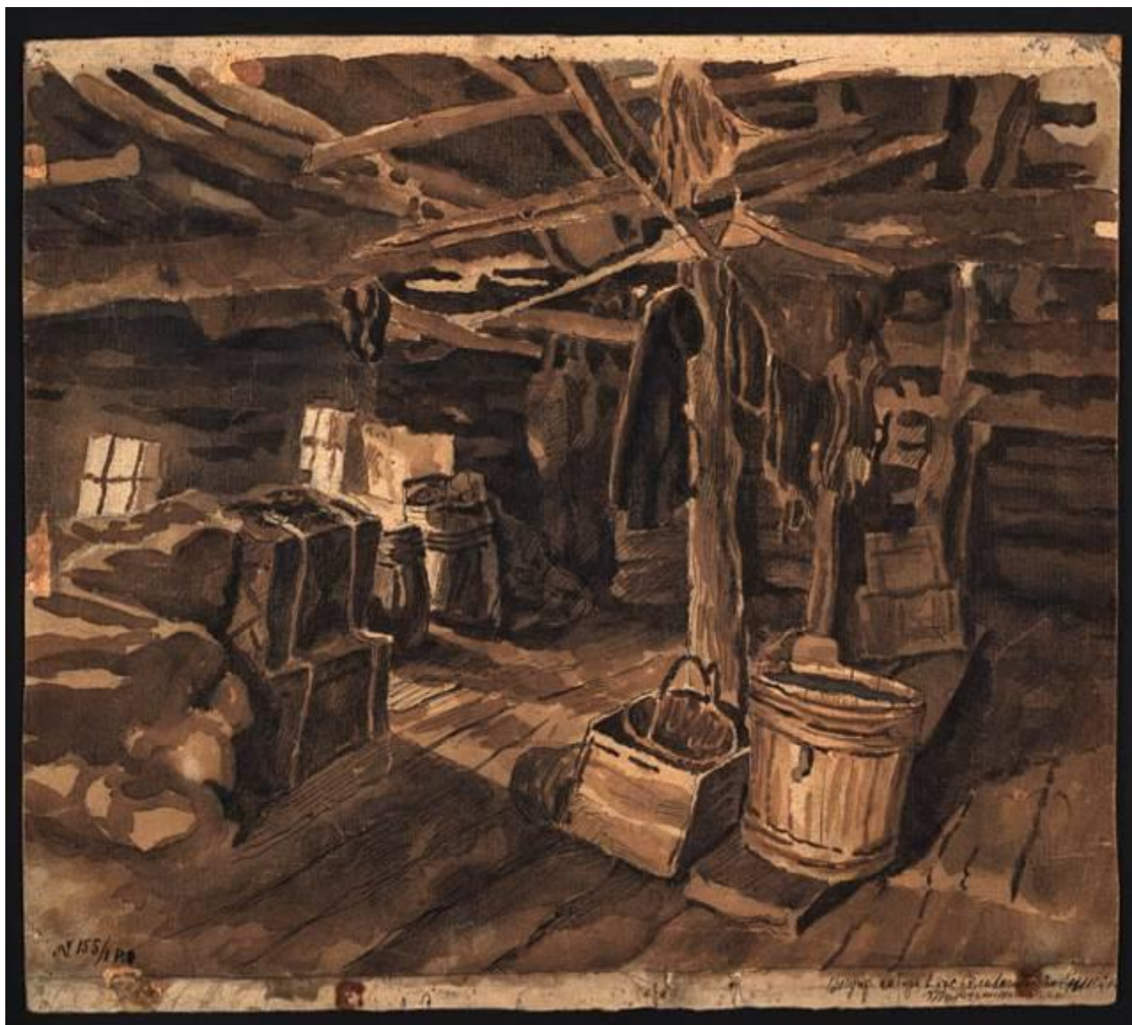
ВНУТРЕННОСТЬ АМБАРА В ПОСЕЛКЕ СЕЛИВАНИХА 1907-40 гг