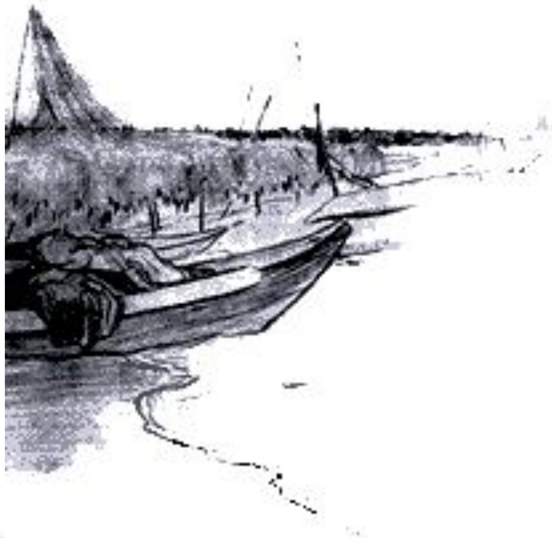
Река Кеть. 1927 г.