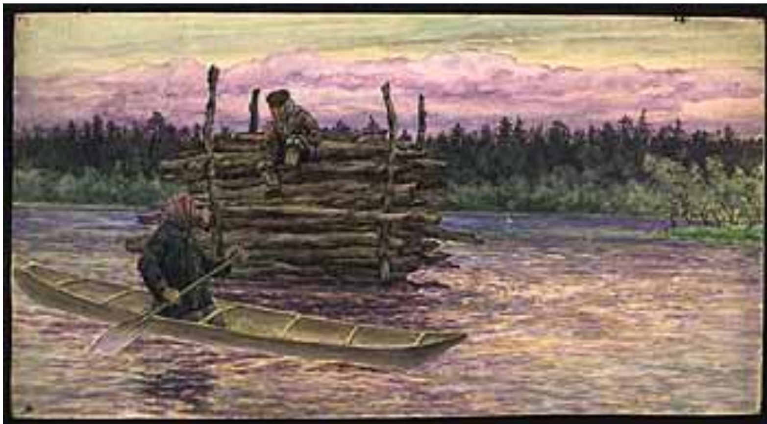
ПЛОТ ИЗ СУШНЯКА