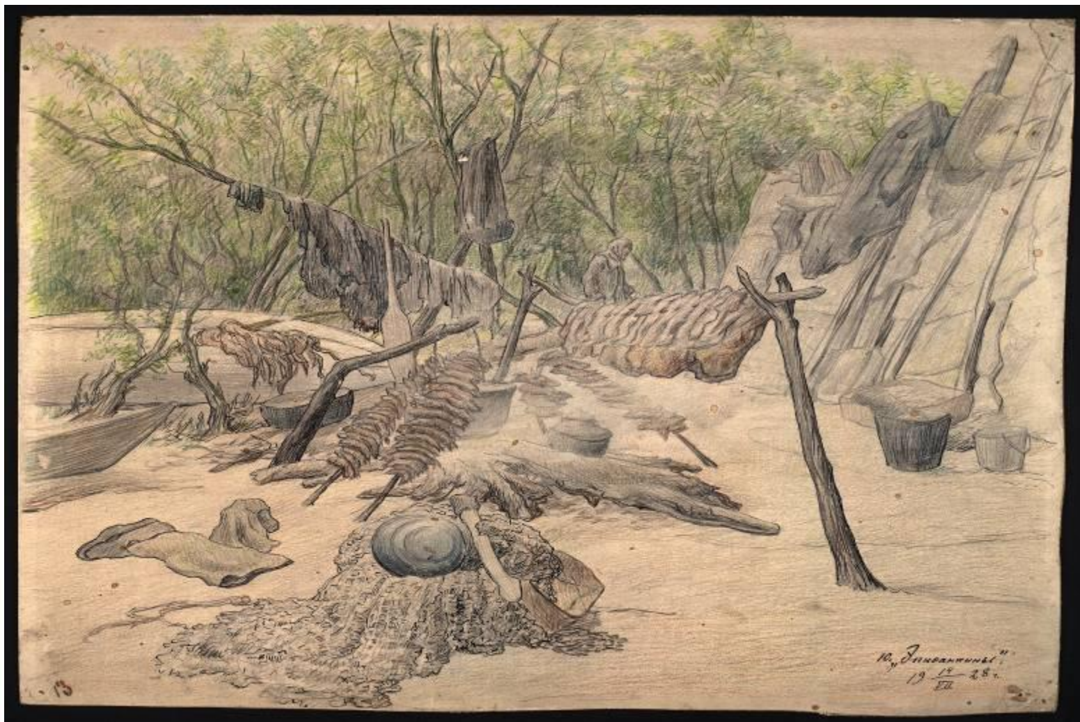
ПРИЕЗД ОСТЯКОВ НА ЛЕТНЮЮ РЫБАЛКУ