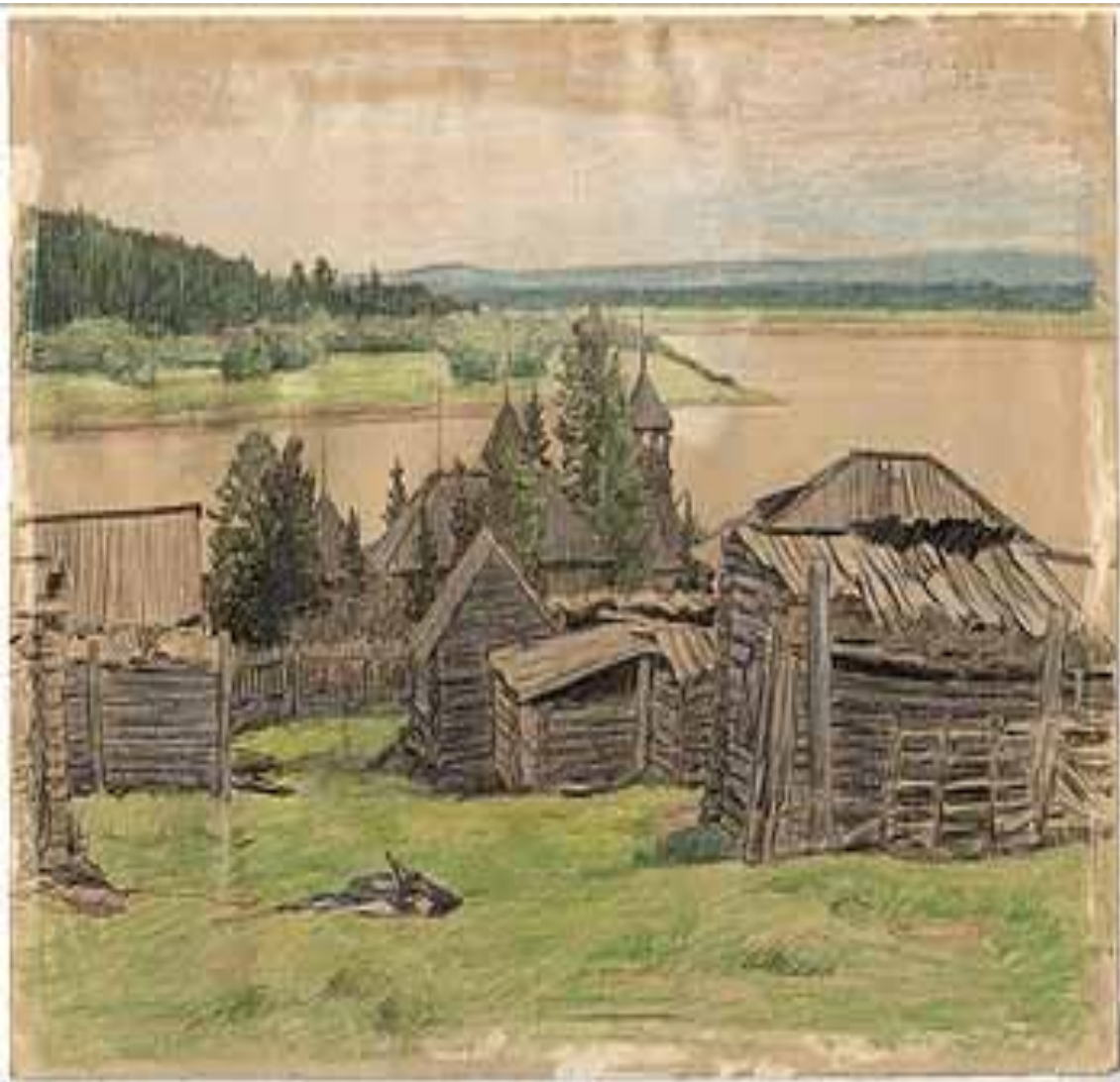
ПОСЕЛОК НА БЕРЕГУ РЕКИ