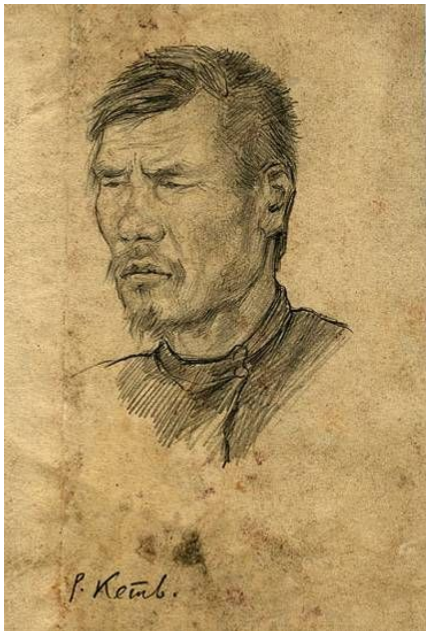
Мужской портрет, река Кеть 1927 г.