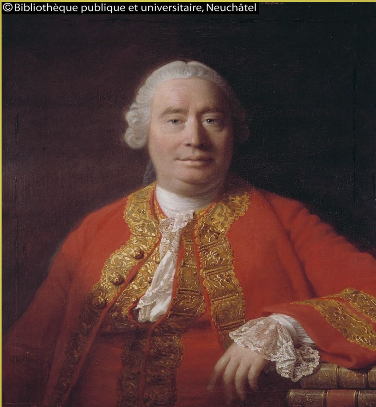
Давид Юм (1711-1776)