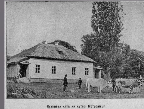
Кулішева хата на хуторі Мотронівці.

Тим часом світ швидко змінювався, душа поета не встигала за ним, хоча й мудрувала на самоті, долаючи духовні вершини. Із відблиском в очах молодого жару, у змаганні знесиленого тіла з творчим духом і пішов