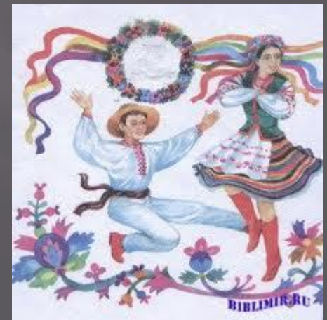
Картинка до твору “Орися”