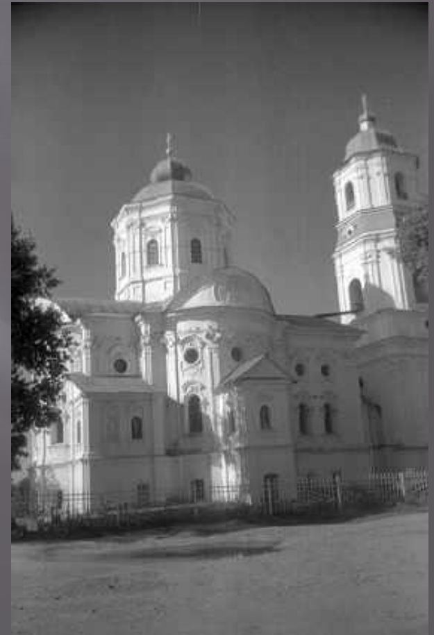
Вороніж, Шосткінський р-н. Сумської обл. Церква.