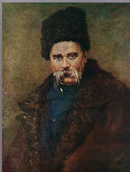
Т. Шевченко Товариш П. Куліша