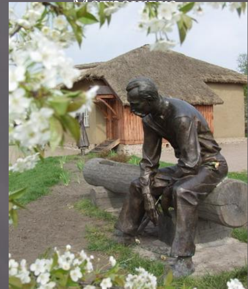
Пам'ятник П. Кулішу на хуторі Мотронівка