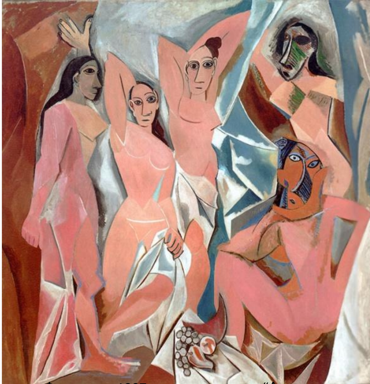
Фернанда 1907 жылы салынған “Авиньондық қыздар” атты Пикассоның Басты суретіне негіз болған.