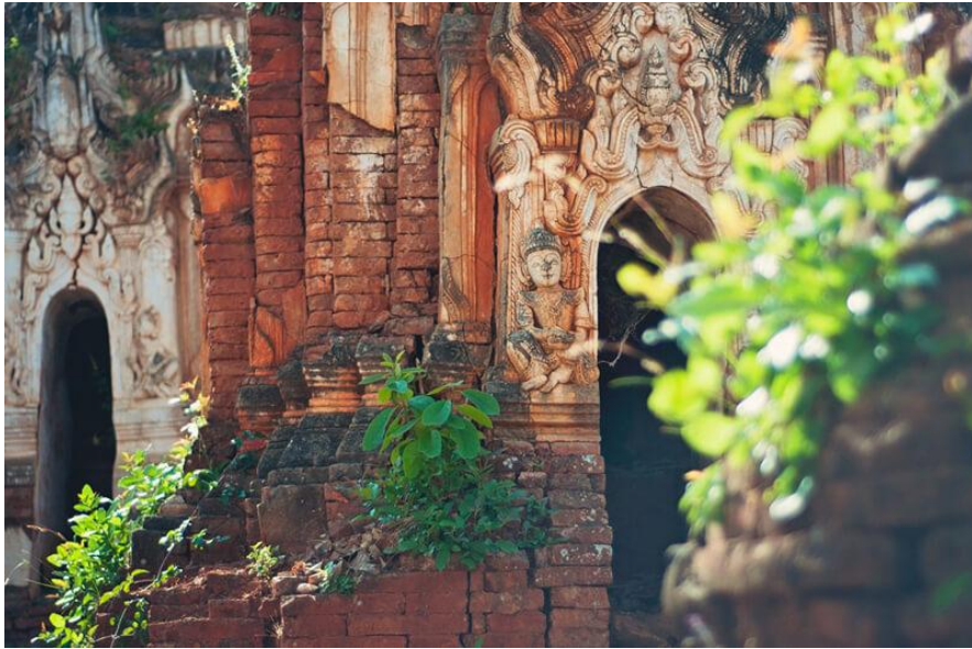
Затерянная храмовая деревня в джунглях Мьянмы