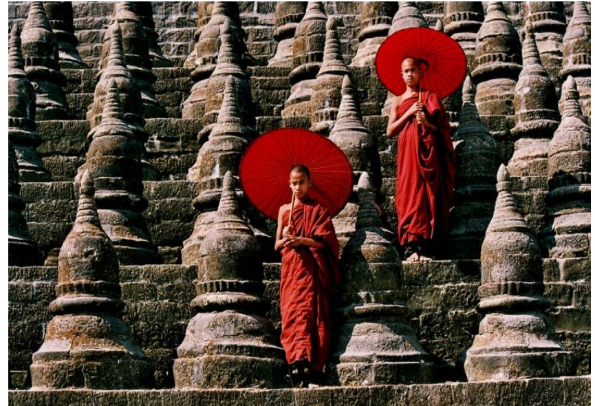
Мьянма, древний город Мраук-У