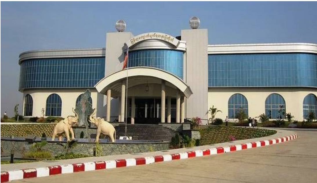
Музей драгоценных камней