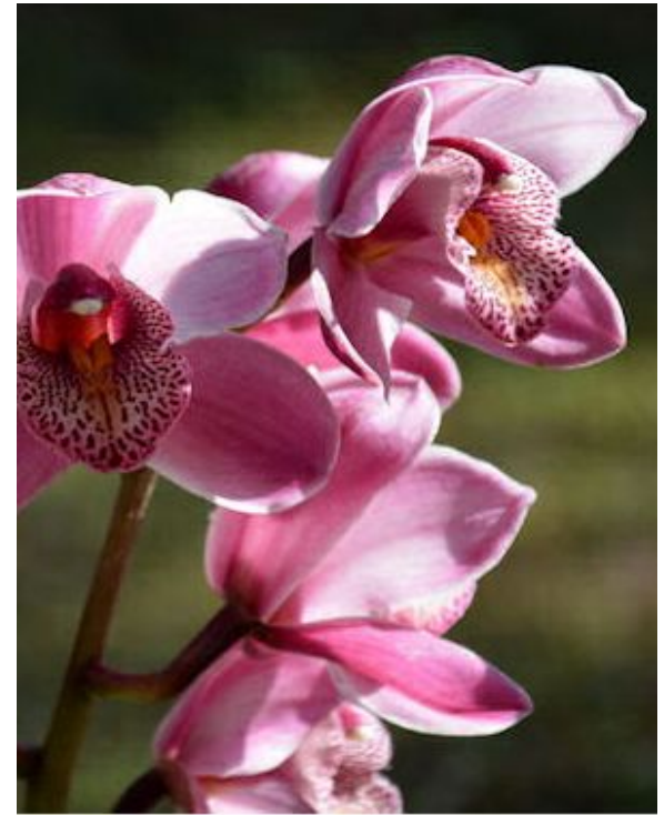
Мьянманские орхидеи (в Мьянме растёт 841 вид)