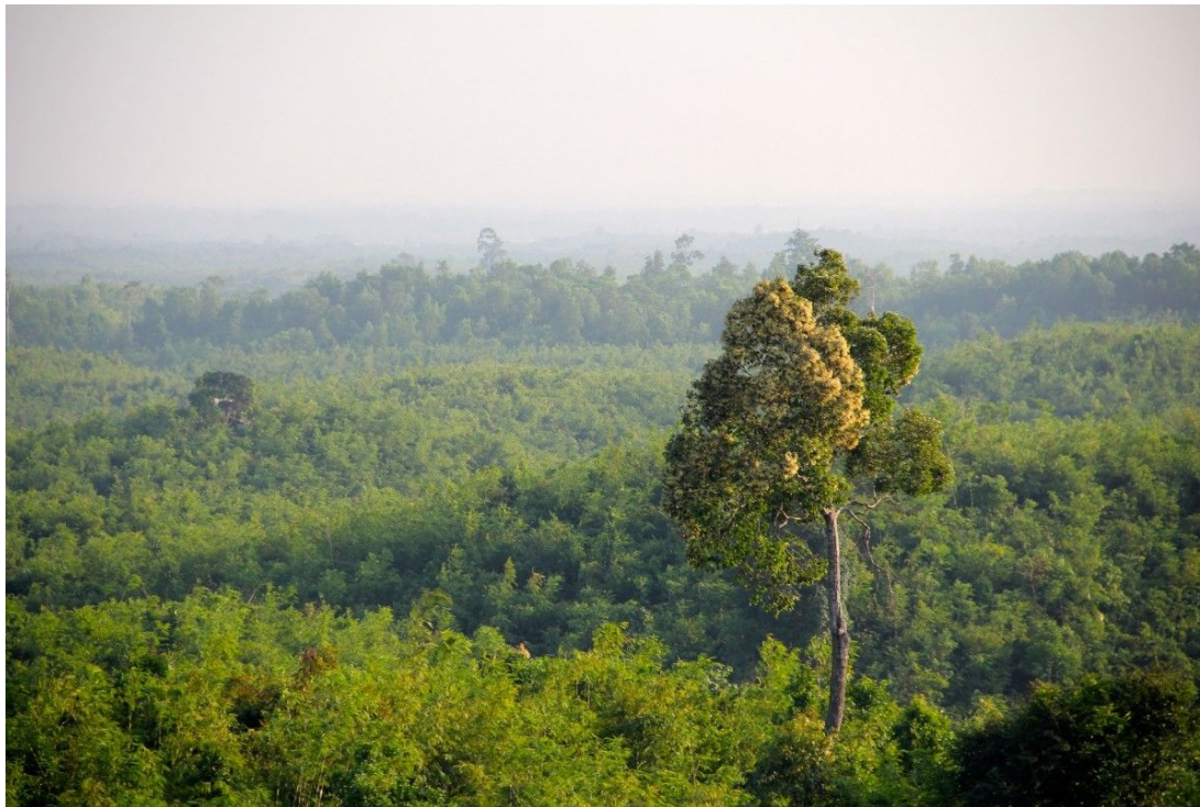
Джунгли в Мьянме