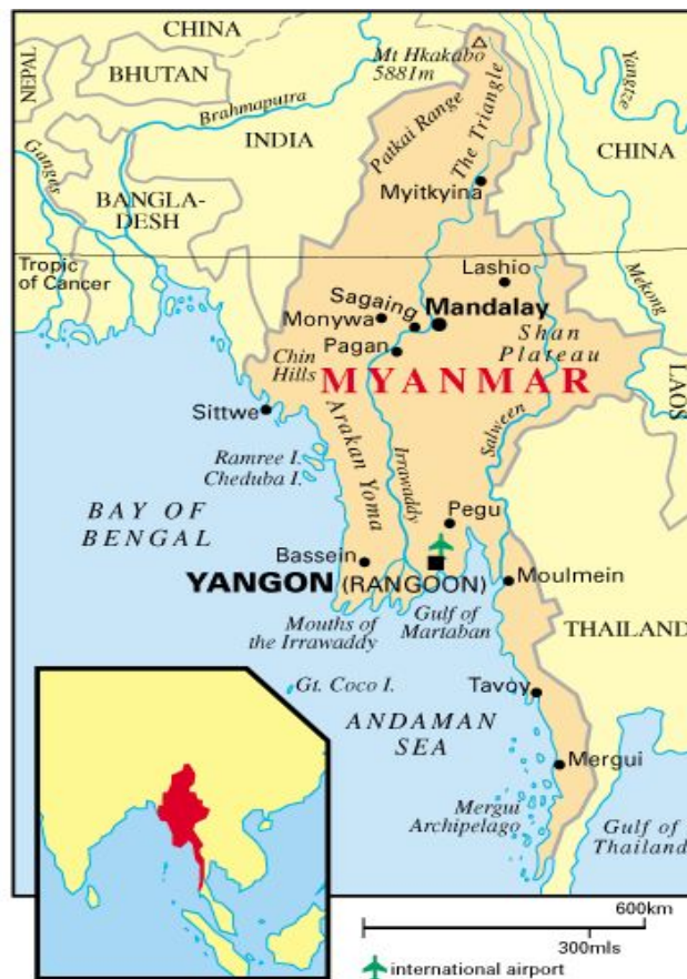
Соседи и положение Мьянмы