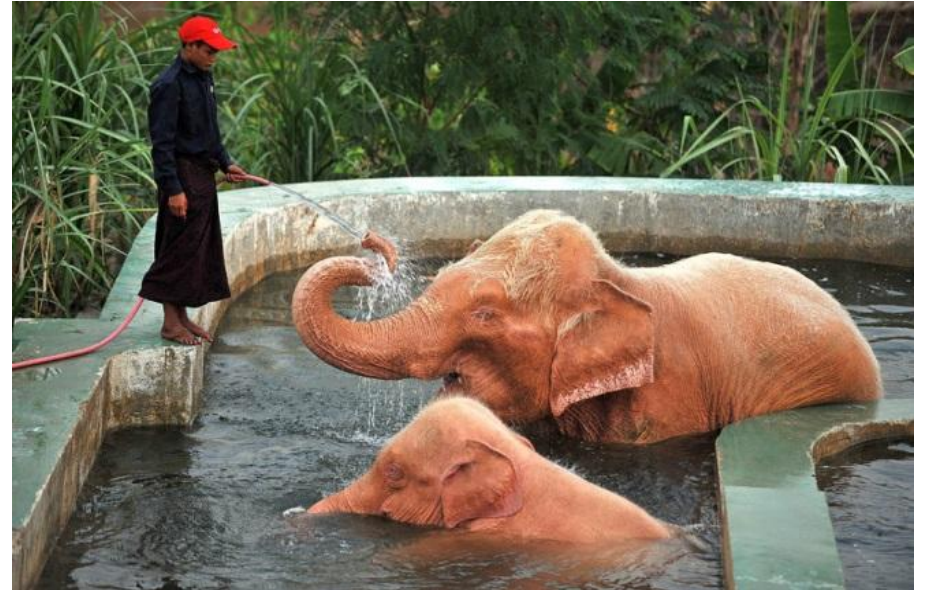
Уникальные розовые слоны Мьянмы