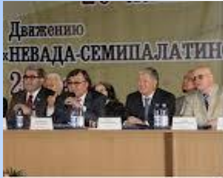
Олжас Сулейменов — лидер антиядерного движения «Невада - Семей»