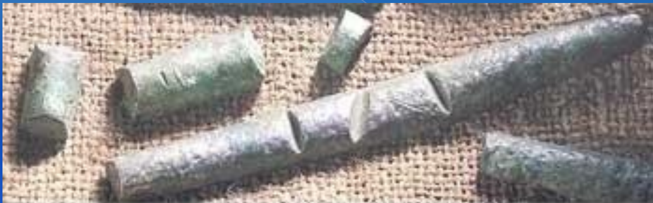
Серебряная гривна и ее части. XIV век.