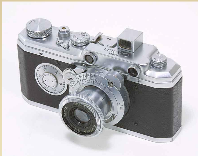
Canon Hansa с объективом Nikkor 50mm f/3.5 1935 год