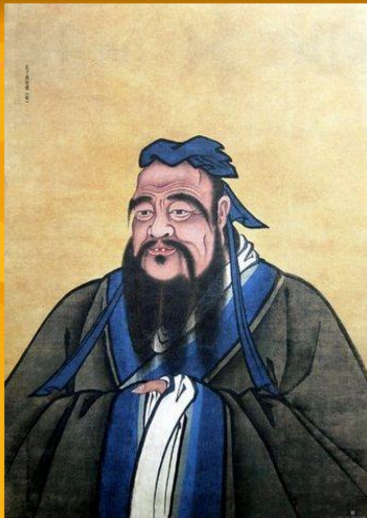
Конфуций(Кун-фу-цзы) « ұстаз-кун»