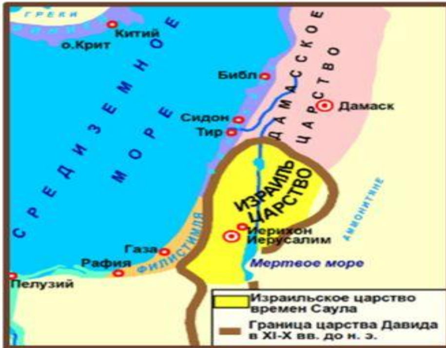
Израиль в древности