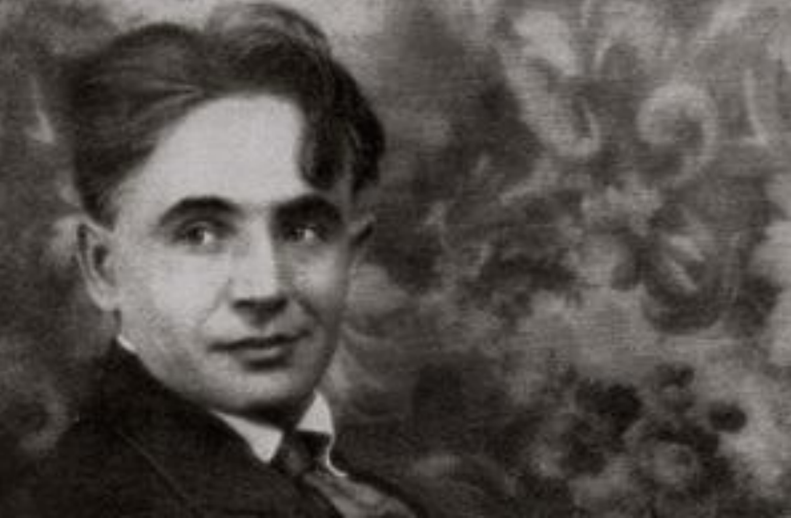
Курбас Олександр Степанович