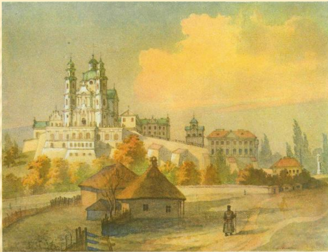
148. ПОЧАЙІВСЬКА ЛАВРА З ПІВДНЯ. Академ.сб. [X. 1846].

На Україні Шевченко написав два поетичних твори — російською мовою поему “Тризна” (1844р. опублікована в журналі “Маяк” під назвою “Бесталанний”) і вірш “Розрита могила”.