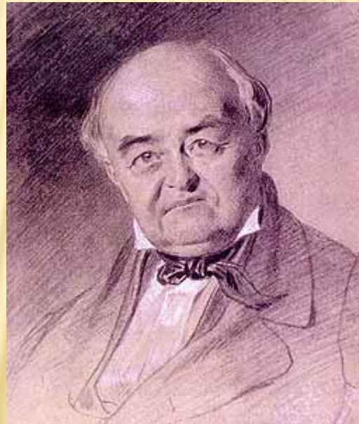
Портрет Михайла Щепкіна