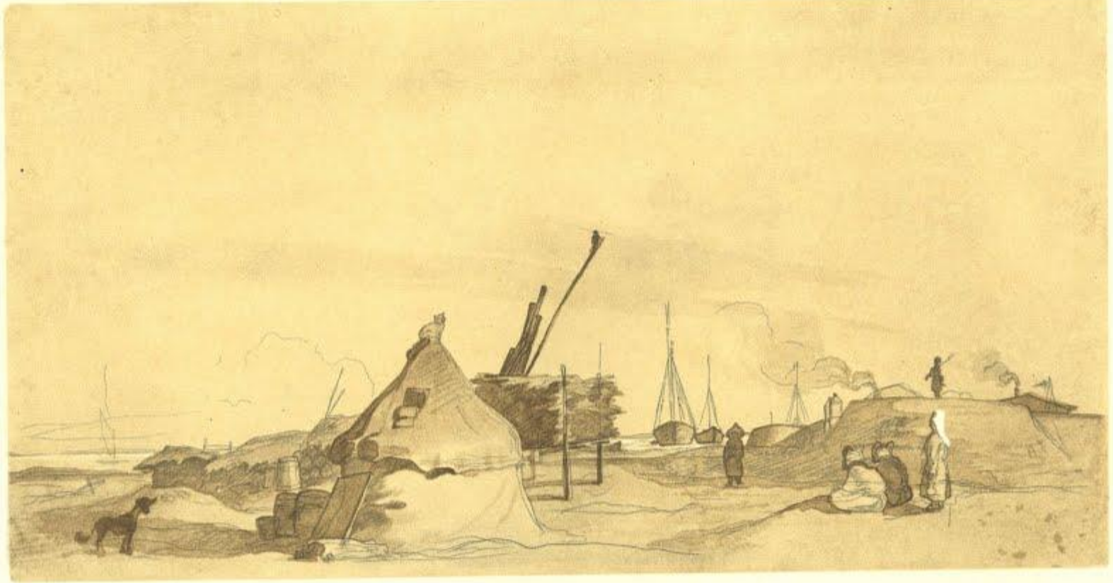
35. УКРІПЛЕННЯ КОС-АРАЛ ВЗИМКУ. Сепія. [6.X 1848—2.IV 1849].

У 1848р. на клопотання Шевченкових друзів його включили як художника до складу Аральської описової експедиції, очолюваної О. Бутаковим. З жовтня 1848р. до травня 1849р. експедиція зимувала на острові Кос-Арал.