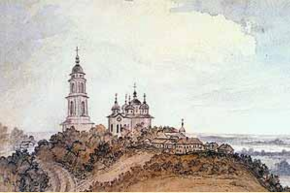
Воздвиженський монастир в Полтаві