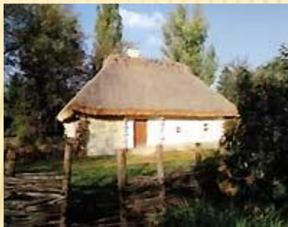
Хата, в якій народився Тарас Шевченко