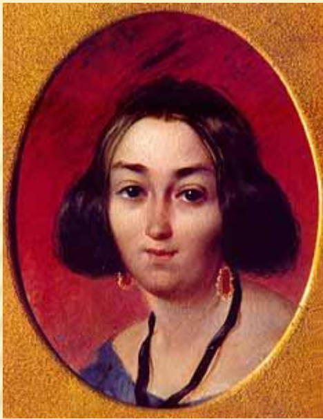
Портрет Ганни Закревської