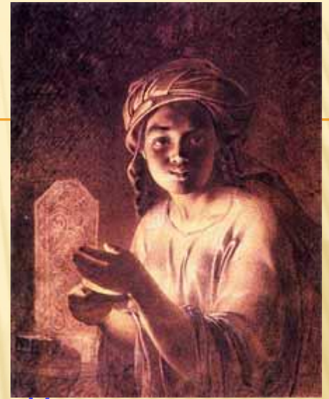
Молитва за вмерших