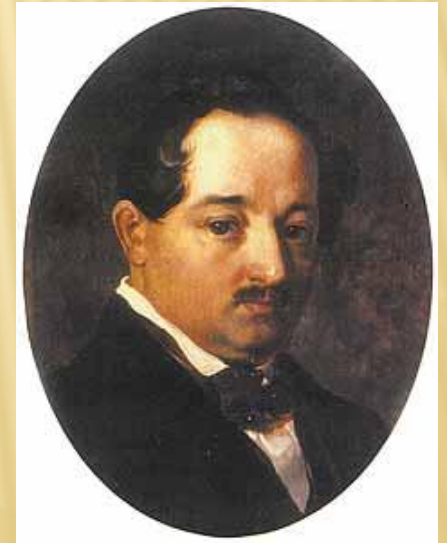
Портрет Платона Закревського