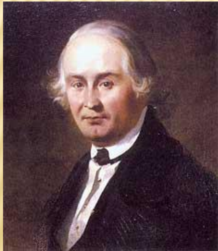
Портрет Іллі Лизогуба