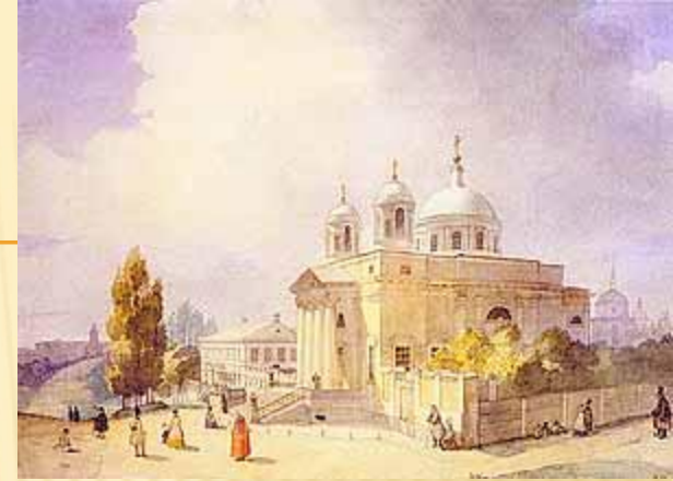
Олександрівський костюл в Києві