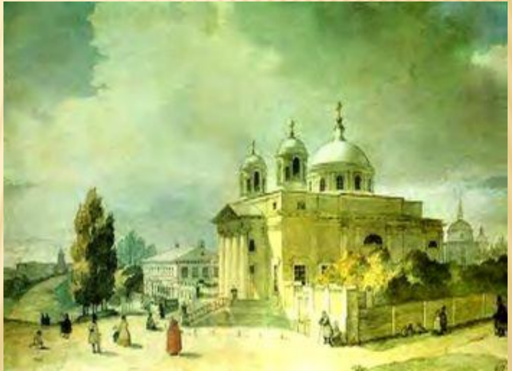
Т.Г.Шевченко. Собор святого Олександра в Києві

Спілкувався з селянами, познайомився з численними представниками української інтелігенції й освіченими поміщиками.