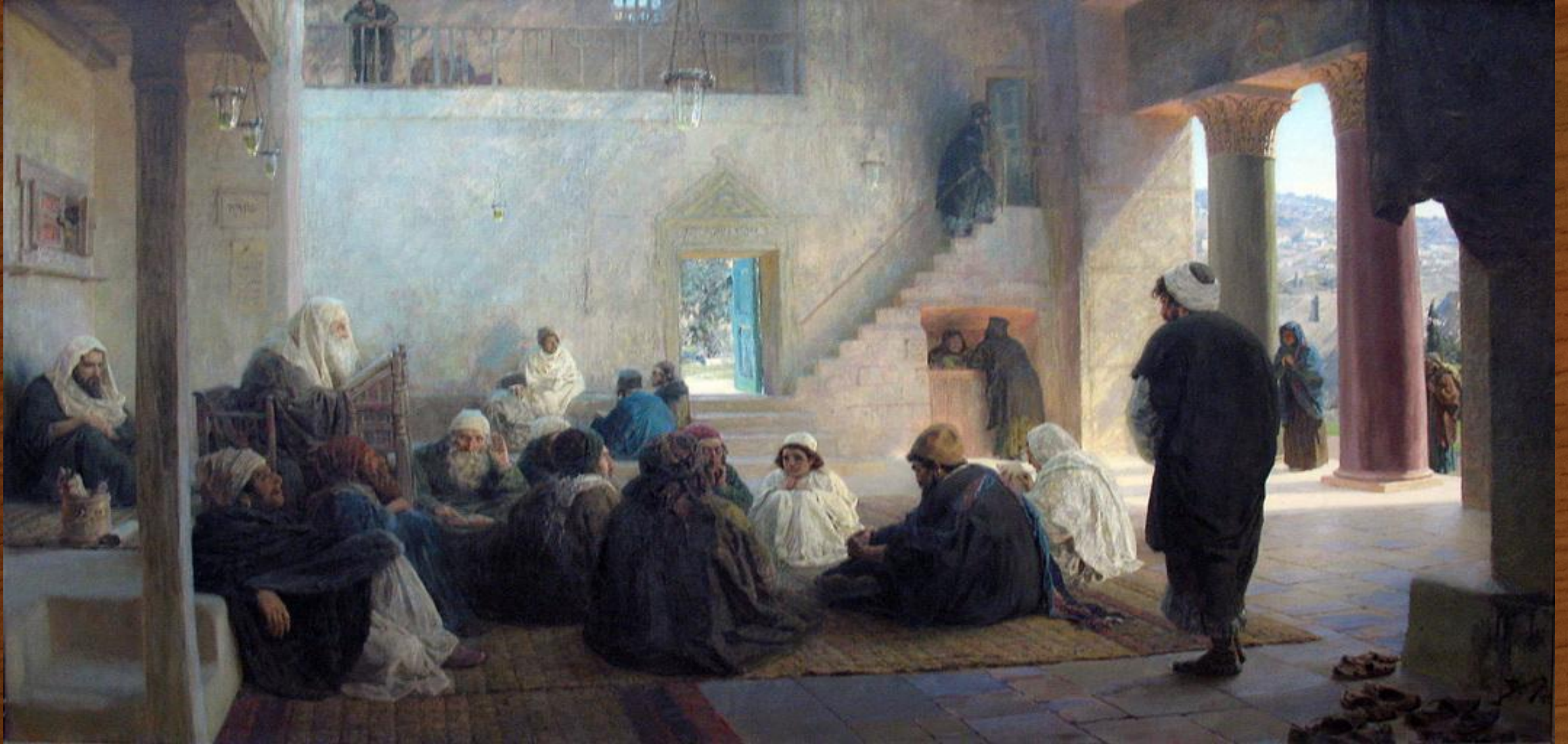
В. Поленов «Среди учителей» (1896).