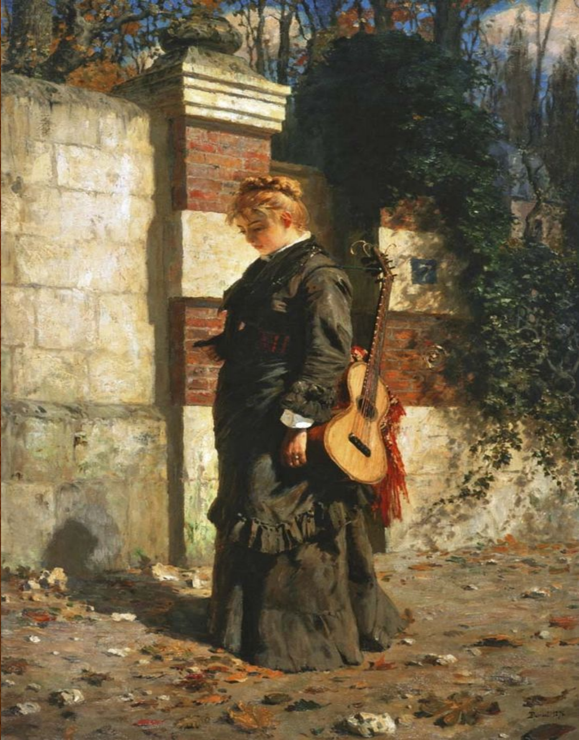
В. Поленов «Стрекоза» («Лето красное пропела...»), 1875-1876