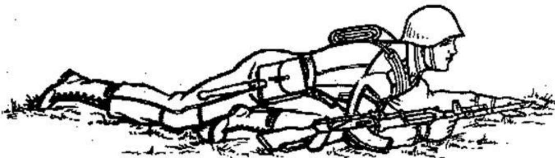
Переползание на получетвереньках