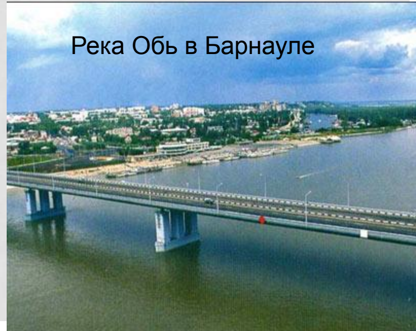
Река Обь в Барнауле