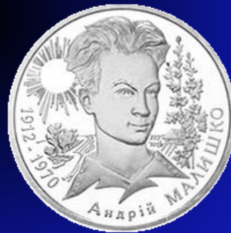
Ювілейна монета НБУ 2003 р.