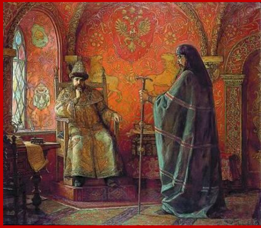
"Царь Алексей Михайлович и Патриарх Никон"

1658 год – Никон удалился в Воскресенский Новоиерусалимский монастырь