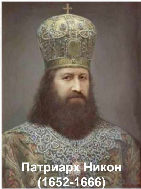
Патриарх Никон (1652-1666)

1652 г. – избрание Никона новым патриархом России