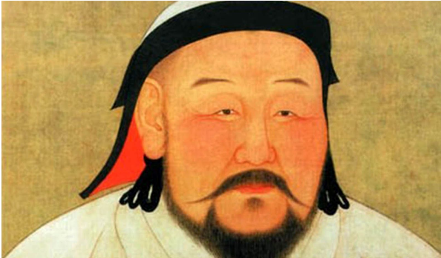
Чингисхан (Темучин) (1155-1227)