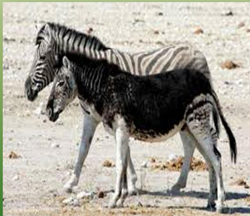
Зебри, які страждають меланізмом