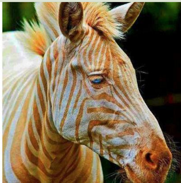
Зебра з золотавими смугами