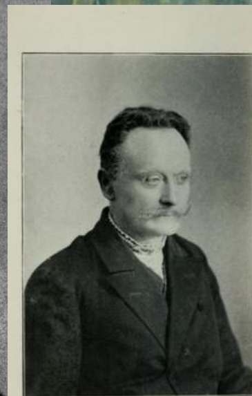
Знято в фотографічній закладі Е. Тимеского для 30. червня 1910.