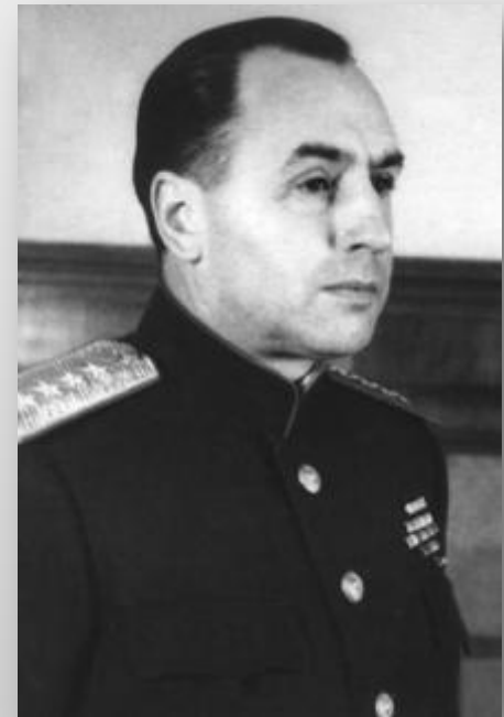
Алексей Антонов, заместитель начальника Генерального штаба РККА, ведущий разработчик плана операции

С немецкой стороны — в составе группы армий «Центр» — 850—900 тыс. человек (включая примерно 400 тыс. в тыловых частях).