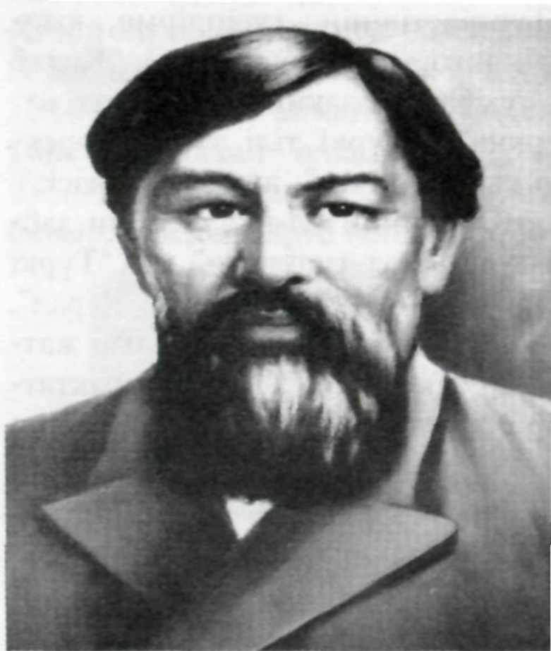
“Ы. Алтынсарин”. Суретші Ә.Бұқарбаев

Қостанай облысы, Затобол ауданында туған.