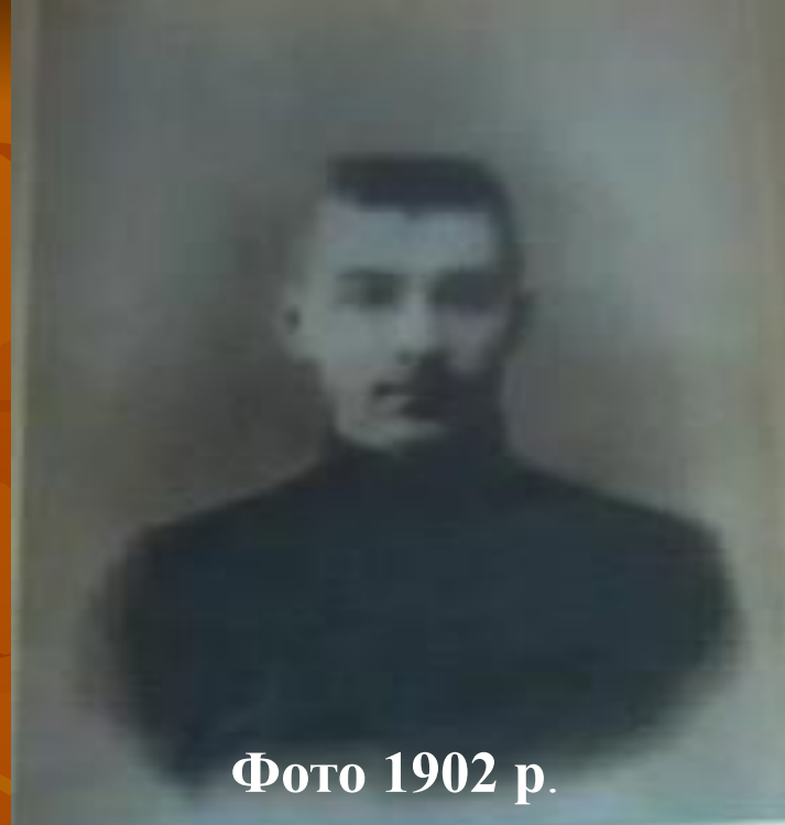
Фото 1902 р.

1900р. екстерном складає іспити у Златопільській гімназії і вступає на юридичний факультет Київського університету.