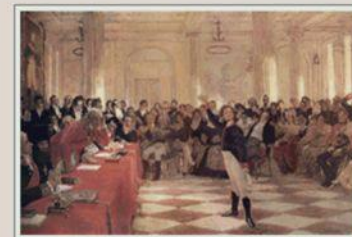
И.Е. Репин. Пушкин на лицейском акте. Холст, масло. 1911. [ВМГ]

На публичном экзамене знаменитый поэт Державин высоко оценил талант юного Александра.