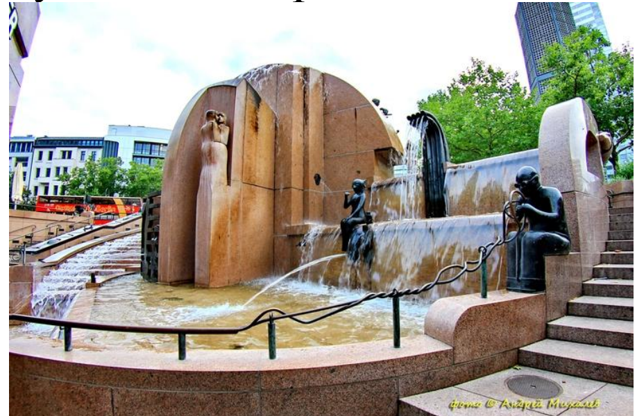
Фонтан «Земной шар», Берлин