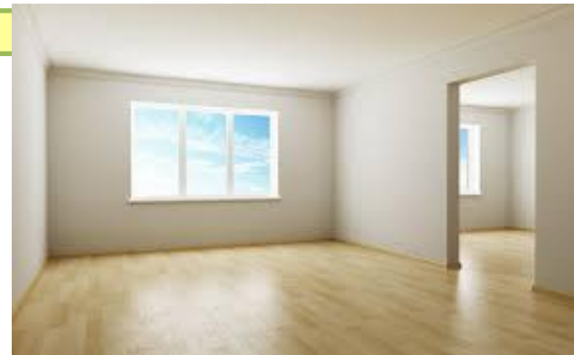
тұруға жарамды жеке бөлме (бөлмелер)