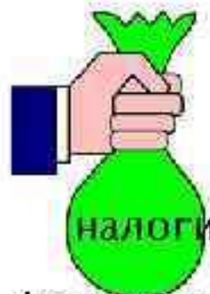
Финансово- кредитное регулирование