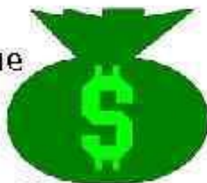
Кредитно- денежная система