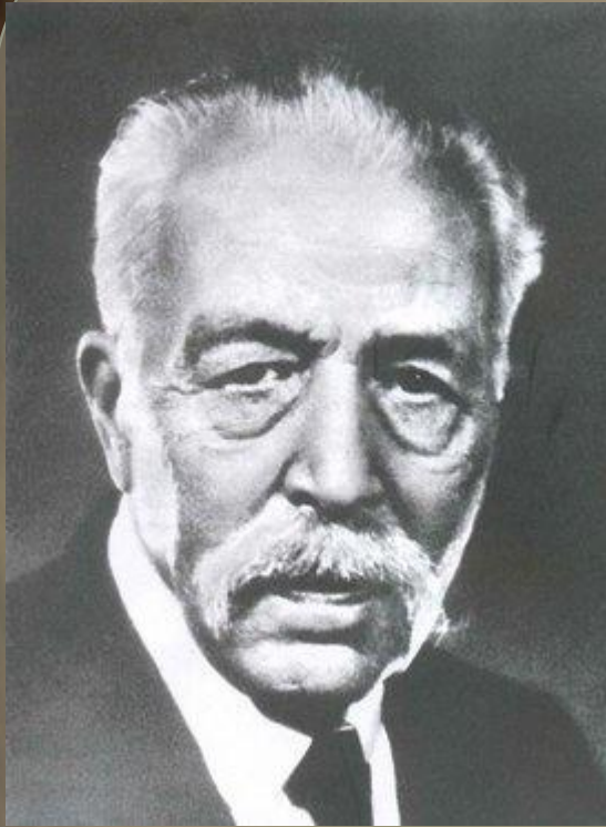
Гаэтано Моска (1858 -1941), итальянский юрист, социолог