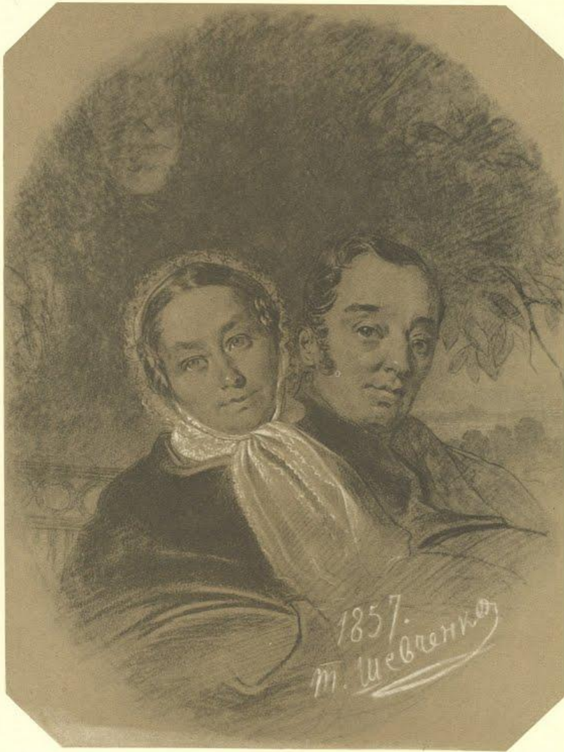
16. ПОРТРЕТ ПОДРУЖЖЯ ЯКОБІ. Італійський та білий олівець. [8—9.XI] 1857.

Він мріяв стати маляром і шукав у навколишніх селах учителя малювання.