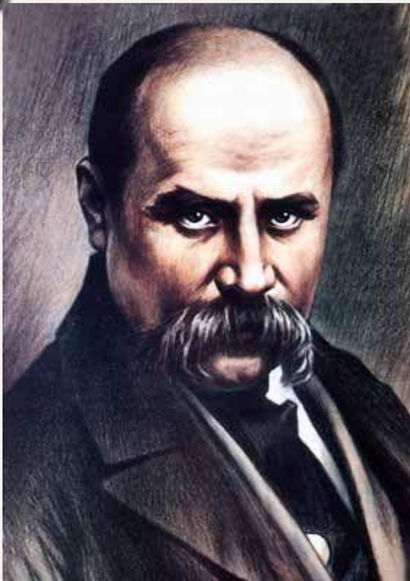
Тарас Григорович Шевченко (1814 - 1861)