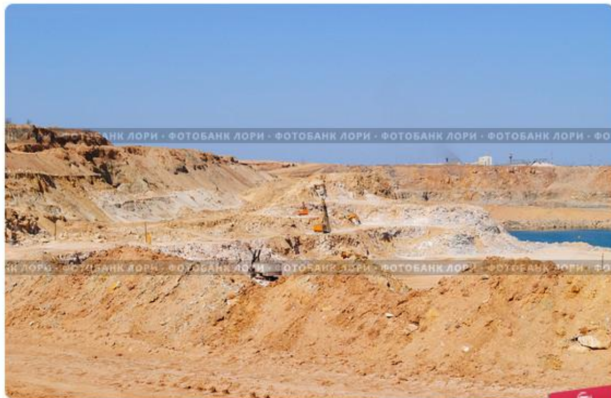
Астраханская область, карьер по добыче известняка