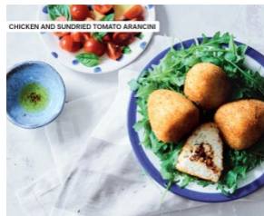
Мясные шарики с моцареллой