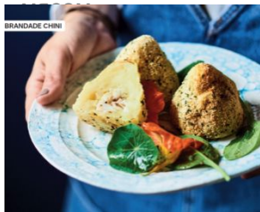
Зразы картофельные с