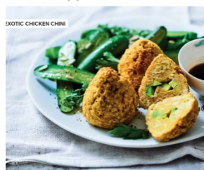
Зразы-карри с авокадо