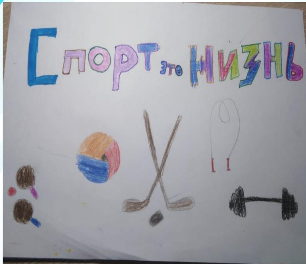
Рисунок Супрунец Артёма, 4 класс