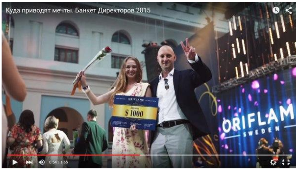
Куда приводят мечты. Банкет Директоров 2015